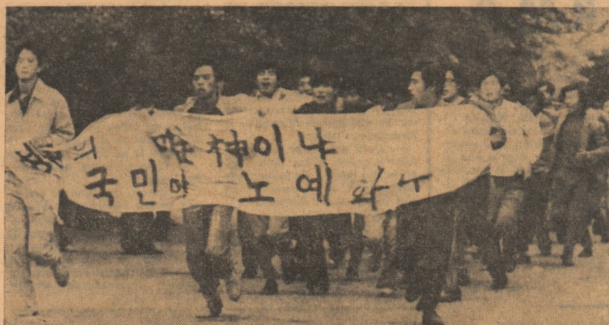
COREEA DE SUD: Demonstrație studențească la Seul, împotriva represuniilor polițienești, pentru democratizarea Universității.

CAIRO. — Secretarul de stat american, Henry Kissinger, a sosit, joi seara, la Cairo, în cea de-a doua vizită pe care o întreprinde în capitala egipteană în ultimele cinci săptămîni. Convorbirile sale cu președintele Anwar Sadat și cu ministrul egiptean de externe, Ismail Fahmy, sint consacrate examinării unor probleme privind conferința de pace asupra Orientului Apropiat, care ar urma să se deschidă la Geneva, la 18 decembrie.