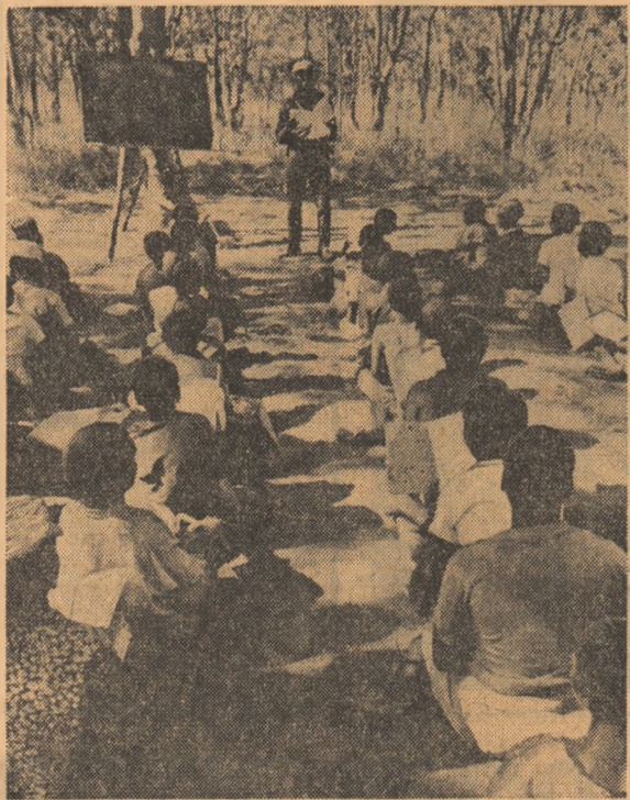
MOZAMBIK. — Școala în aer liber într-una din zonele eliberate ale țării

Abba Eban, ministrul Afacerilor Externe, a declarat că Conferința de pace de la Geneva asupra Orientului Apropiat va fi reluată „din timp în timp” la nivelul ministrilor de externe, dar că negocierile principale vor avea loc în grupurile de lucru speciale. El a menționat, de asemenea, că Iordania s-a pronunțat, în cursul primei faze a conferinței, pentru negocieri în vederea separării forțelor la frontiera sa cu Israelul.