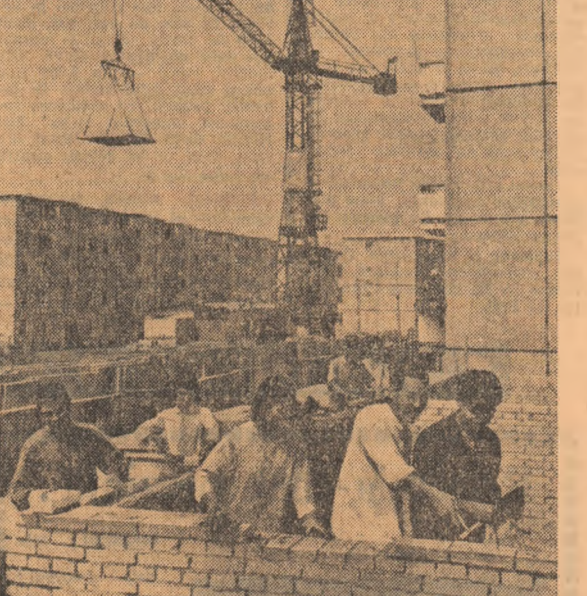
R.P. CHINEZA. — Studenți de la Facultatea de arhitectură din Pekin în timpul practicii pe șantierul de construcții.

DOUĂ „OBIECTE MISTERIOASE” au fost văzute pe cer, duminică, la Roma, în apropierea pieței San Pietro, de mai multe persoane informatează agenția France Presse. Potrivit măturătorilor, era vorba de două corpuri rotunde și de culoare alburie. Cele două corpuri, care pareau de două ori mai mari decât luna, au efectuat o amplă mișcare circulară pe cer, timp de circa 20 de minute.