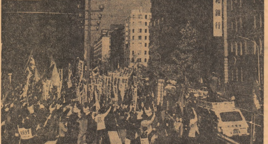
JAPONIA. — Aspect de la un recent marș al muncitorilor din Tokio în sprijinul revendicărilor lor social-economice

la vechii publice și religioase sud-coreene a inițiat o campanie la scară națională, în scopul stringerii de semnături în favoarea unei inițiative democratice. Acești militanți au declarat că vor cere oficial așa-zisului „președinte”, Pak Cijan Hi să introducă o moțiune în vederea modificării actualei constituții”, considerate total nesatisfăcătoare de populația sud-coreeană. Imediat după inițierea acțiunii, au și fost strinse primele cîteva mii de semnături. Pe de altă parte, la Seul s-a desfășurat o adunare, în cadrul căreia peste 20 de clerici reprezentînd diferite confesiuni ale religiei creștine au dat publicității o declarație în favoarea instalării democrației și libertăților cetățenești în Coreea de sud.