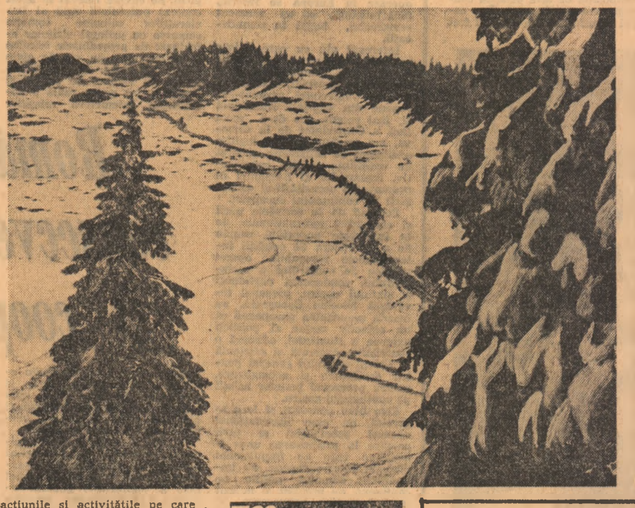
acțiunile și activitățile pe care le organizează și această categorie de tineri. Faptul se explică prin aceea că agențiile așteaptă solicitările la birouri, activiștii acestora nu se duc în săte să prezinte ofertele, să facă înscrieri aici, în așezările rurale, unde, se știe, lucrurile sînt oarecum mai inerte. De ce n-ar putea fi așezată în fiecare comună o hartă turistică, măcar a județului, și cu această întrebare de solictare și recomandare a tinerilor frunțași, a celor merituosi, spre a beneficia de facilitățile acordate, în scopul dezvoltării turismului sătenesc? Organizarea acțiunilor și formarea grupurilor nu se înscriu în cotele și cerințele sistemului educațional, au rămas la stadiul aceluiași dosare reci, birocratice. Cum o să facem, atunci, educație patriotică și cetățenească tinerilor săteni dacă nu-i ducem să viziteze și să cunoască măcar realizările și frumusețea propriului județ, ale județului din împrejurimi? Iată o întrebare pe care trebuie să și-o pună toți activiștii U.T.C., dar mai ales cei care lucrează în domeniul turismului pentru tineret.