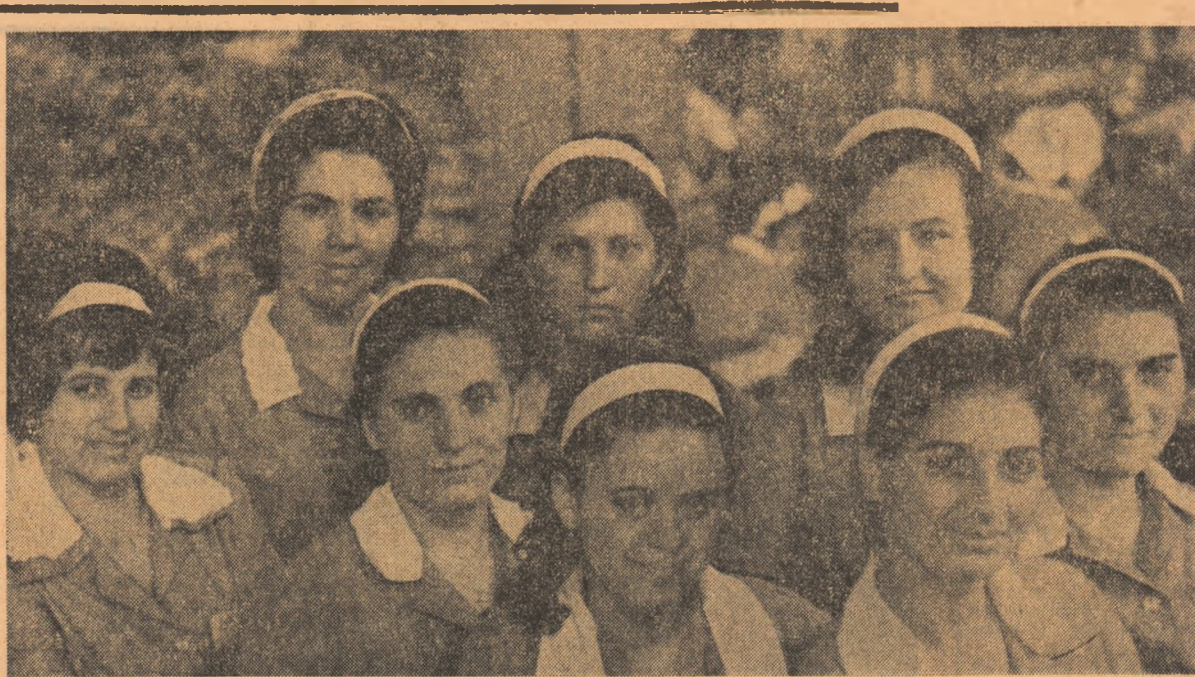
Tinerele din fotografie — ucești de la sectorul III al Fabricii de confecții din București — zîmbesc fericele: organizația din care fac parte este una dintre fruntașele întrecerilor „Tineretul — factor activ în îndeplinirea cincinalului înainte de termen“ din fabrică.