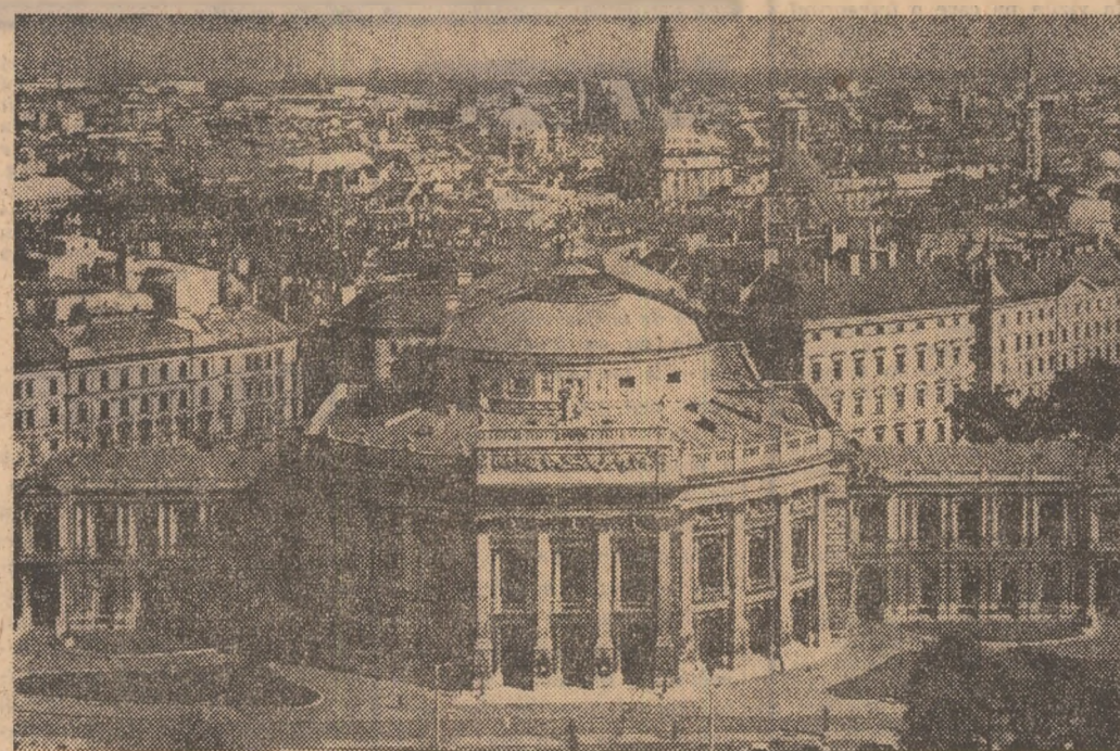
Imagine din Viena, capitala Austriei.

lucru de trei zile, liderii a peste 100 de uniuni sindicale britanice au aprobat cu o mare majoritate de voturi planul de reglementare a crizei prezentat guvernului de centrala sindicală T.U.C. Acest plan, care reclamă un tratat special pentru mineri în schimbul unor garanții privind situarea revedicării ce urmează a fi prezentate de alte uniuni sindicale