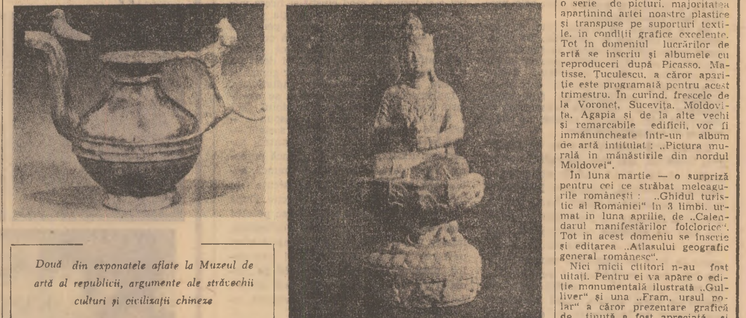
Doi din exponatele aflate la Muzeul de artă al republicii, argumente ale străvechii culturi și civilizații chineze

Originalitatea stilizării, îndrăzneala unor soluții plastice, uimesc mai ales prin lipsa unor repere intermediare în evoluția lor, repere pierdute probabil în timp. Muzeei gînditori și reformatori chinezi s-au manifestat mai ales ca păstrători intranșigenți ai tradiției, pe care o restabileau în perioada de criză. Creația artistică se confundă cu civilizarea modelului, operație avîrșită adesea de artizanii geniali. Esența lucrurilor nu poate fi surprinsă, enunșă pictorul Hsie Ho (sec. al V-lea) autorul celebrului tratat de pictură „Sase principii”, decît copind. Analiza nu presupunea decompunere și repetarea experiențelor individuale, ciclic, ci refacerea exactă a ansamblului de