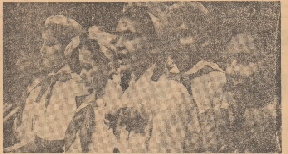
In fața cuptoarelor tinerii oțelari veghează la purita- tea oțelului elaborat

ORGAN CENTRAL AL UNIUNII TINERETULUI COMUNIST