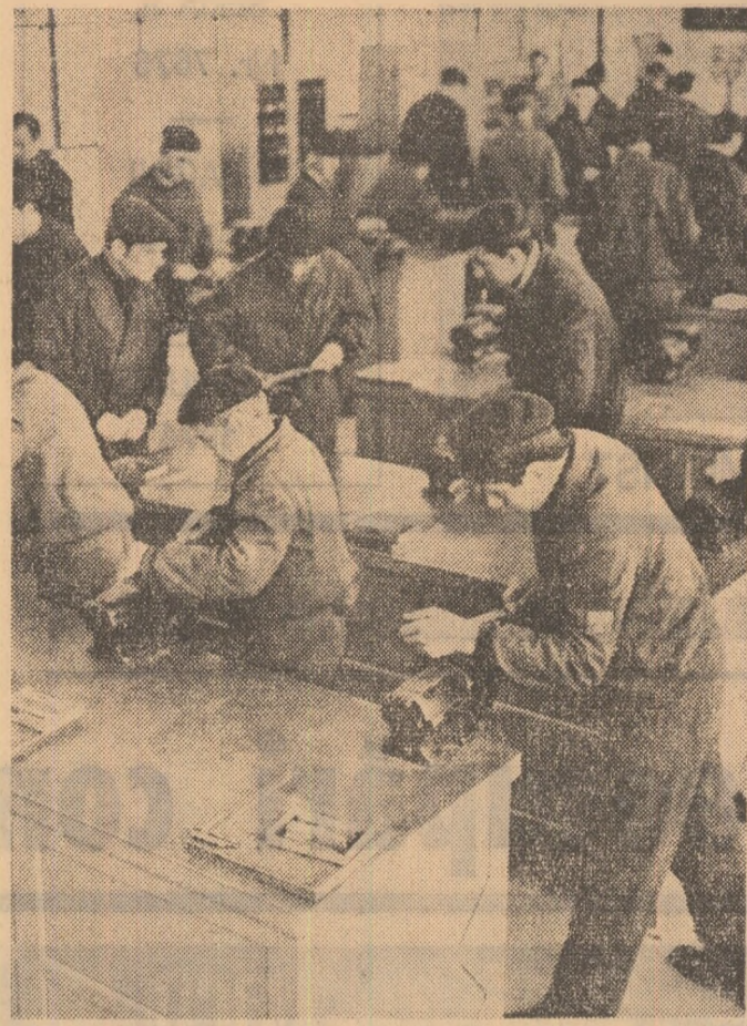
Oră de practică în atelierul școlii

— realizarea planului propriu privind volumul de lucrări exprimat valoric și încadrarea ac-