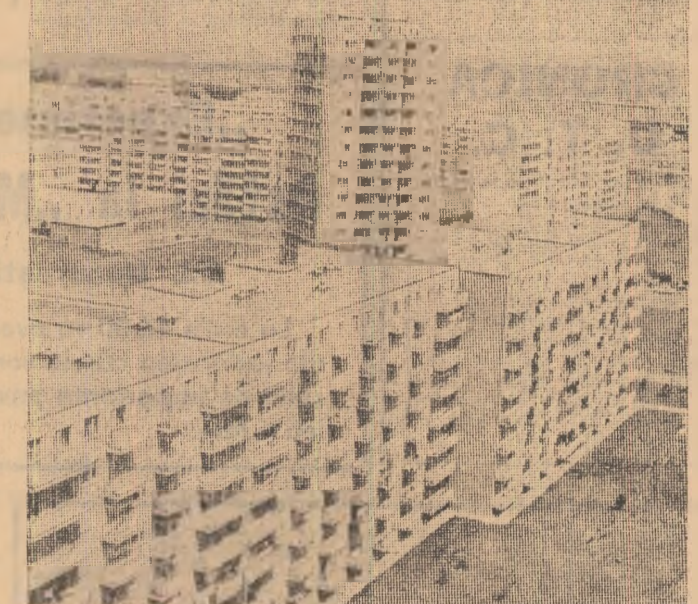
Construcții noi în cartierul Mladost din Sofia.

ajuns cel mai mare oraș 3 milioane de locuitori, Sydney este, însă, și cel mai vechi oraș al continentului și aceasta explică existența unor opere arhitectonice în cel mai pur stil georgian și victorian. Un spectacol deosebit se oferă turistului într-un week-end la Sydney Harbour. Portul este unul dintre cele mai mari, mai adînci și mai frumoase din lume, oferind ochilor o mare varietate de imagini. Aici și la Watsons Bay, probabil singurul loc în care natura a rămas total sălbatică, se obțin — spun localnicii — renumitele stridii, tot după băștinașilor „cele mai deosebite” din lume! Nu poți vorbi, însă, de Sydney Harbour fără a pomeni niște despre Opera House. Văzută cel mai bine din Miller's Point, opera a fost realizată într-o concepție arhitectonică unică, îndrăznească, frumoasă. Terminată la această