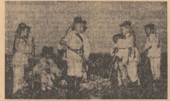
Micutil cetățeni al sectorului 7 din Capitală și-au adus și ei contribuția la aniversarea „Unirii”. În fotografia se imaginează spectacolul copiilor de la grădinița Nr. 57.

Tovarășul NICOLAE CEAUȘESCU, secretar general al Partidului Comunist Român, a trimis tovarășului AHMED HASSAN AL-BAKRI secretar general al Partidului Socialist Arab Baas din Irak, următoarea telegramă: