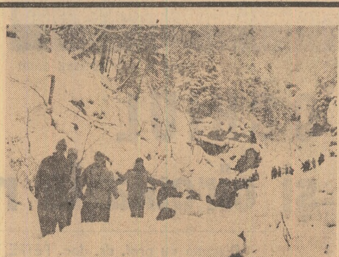
Pe traseele turistice

DRAGOMIR HOROMNEA (Continuare în pag. a III-a)