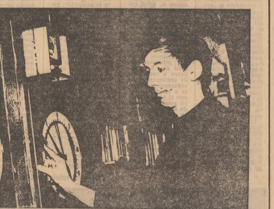
Înainte de a înțelege miracolul transformării materiei în rețelele tehnologice, trebuie să descifrezi acest proces la scară... eprubetelor din laborator.