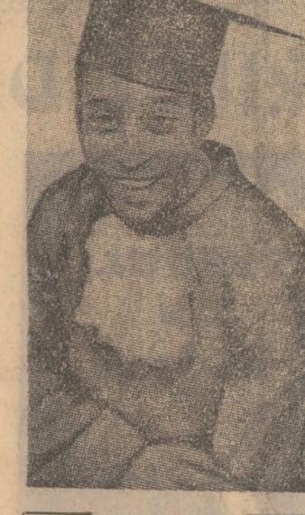
Pele, marea vedetă a fotbalului brazilian, și-a luat recent licența în educație fizică. El a părăsit echipa națională în 1971, însă mai este activ la clubul său Santos.

● APROXIMATIV 14.700.000 ALECĂTORI birmanezii s-au prezentat, duminică, în fața urnelor pentru a-și alege pe membrii Adunării Naționale și al consilierilor locale, conform prevederilor noii Constituții.