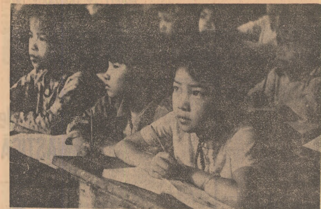
VIETNAMUL DE SUD: Oră de curs la o școală elementară înființată într-un sat din zona eliberată a provinciei Quang Tri.

Cuvîntarea de salut a fost primită cu căldură, fiind deseori punctată cu aplauze. Președintele Gaffar Numeiri, care prezidează lucrările Congresului, a mulțumit călduros pentru mesaj și a transmis, la rândul său, președintelui Nicolae Ceaușescu și poporului român prieten cele mai bune urări de ferticitate și prosperitate.