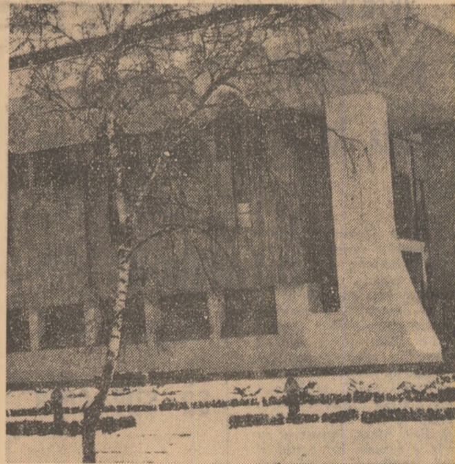
Casa de cultură a sindicatelor din Sibiu — monument de perfectă simbioză între elementele tradiționale și moderne ale arhitecturii