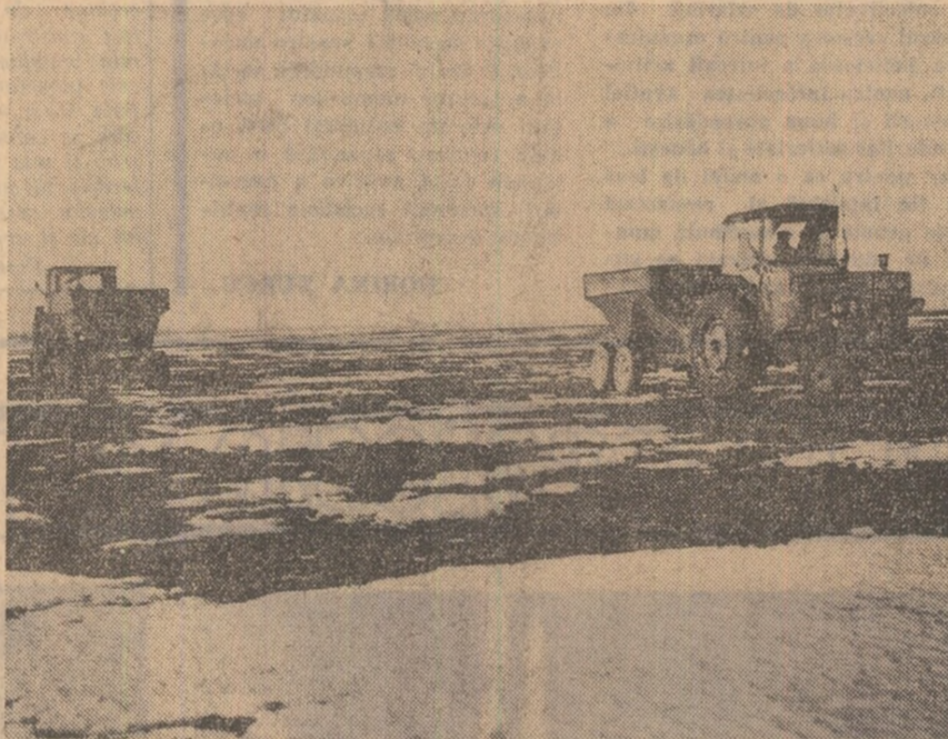
Fertilizarea culturilor de toamnă cu îngrășăminte azotoase — iată activitatea „la zi” a mecanizatorilor de la Ferma nr. 2 „Progresul” din județul Ilfov.