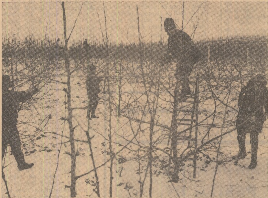
Așa cum se vede și din imaginea de mai sus, la I.A.S. Murlator, campania de primăvară a început deja, lucrările de întreținere a livezilor desfășurându-se din plin potrivit unui grafic bine chibzuit și îndeaproape urmărit.

● PĂMÎNTUL — O AVUȚIE CE TREBUIE MAI BINE GOSPODĂRITĂ