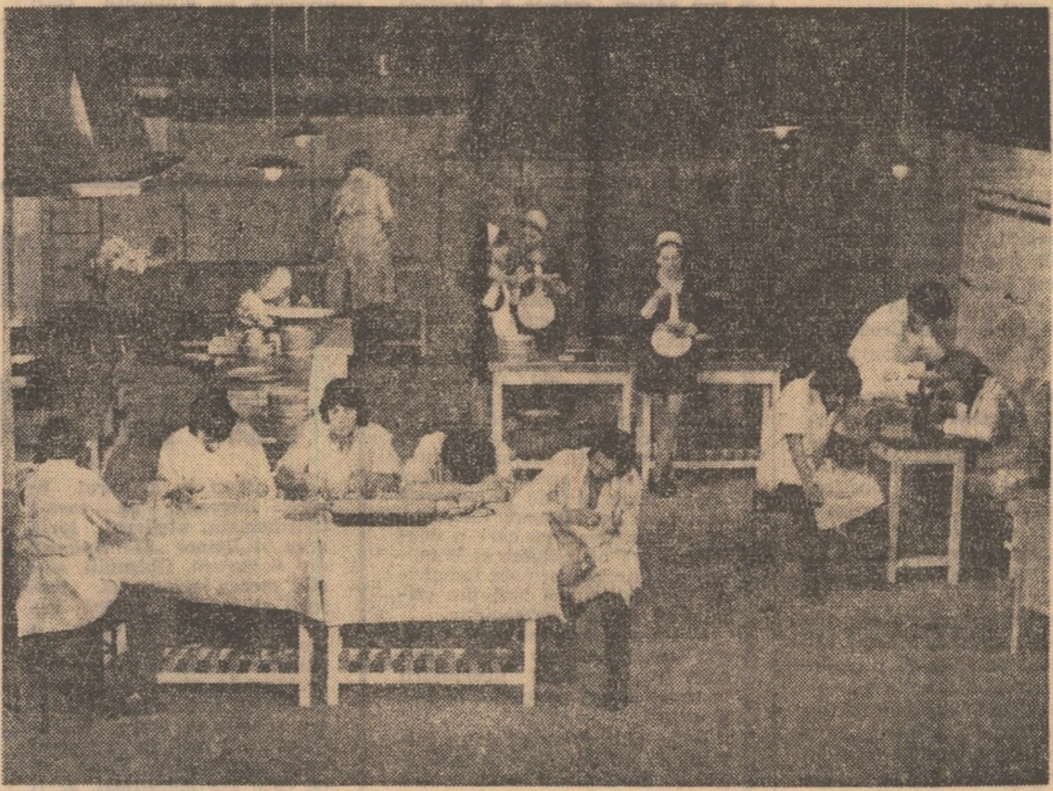
Scenă din piesa „Bucătăria”