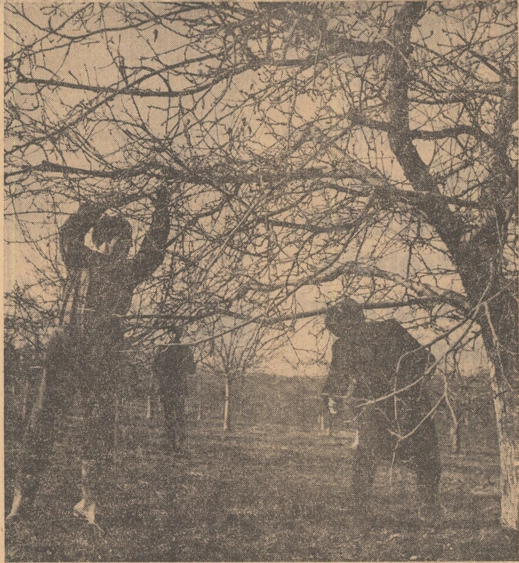
În aceste zile, în livezile I.A.S. Lugoj se execută o operație de care depinde recolta viitoare: tăierea uscăturilor

Annual, de la serele din Tirgul Secuiesc pleacă spre Brașov, Miercurea Ciuc, Odorheul Secuiesc și alte orașe din zona de munte, zece de tone legume, mil de fire goasoase.