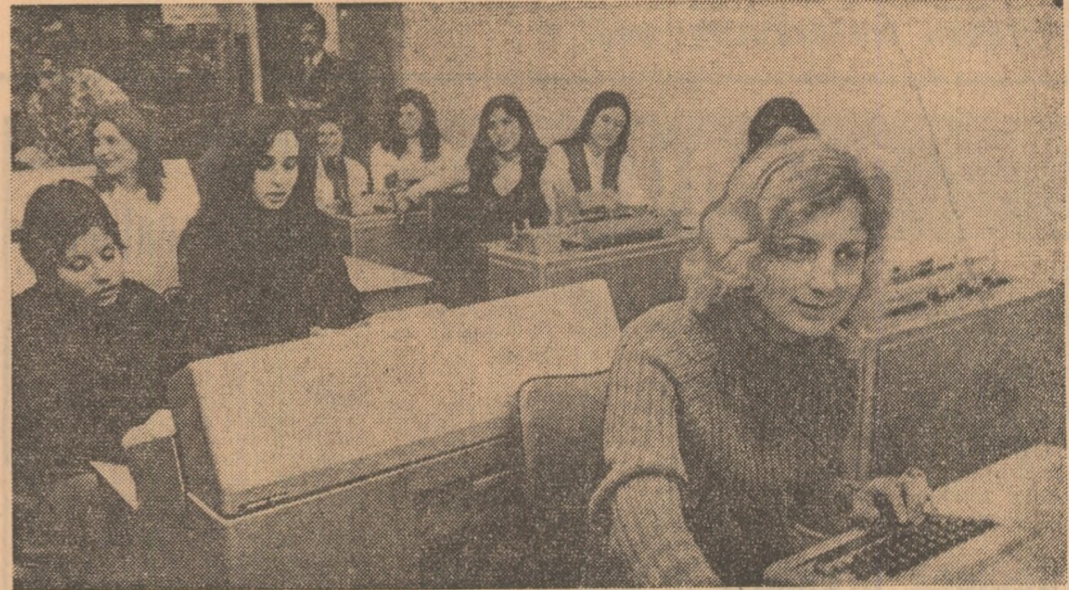
R. P. BULGARIA: Studenți ai Institutului superior de finanțe „Dimitar Tsenov” din orașul Svislov, în timpul cursului de practică în domeniul prelucrării informației economice cu ajutorul computerelor.