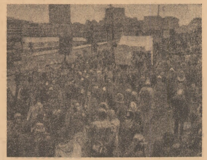
MAREA BRITANIE: Mii de studenți englezi au demonstrat zilele trecute la Londra pentru îmbunătățirea condițiilor de studiu și viață.

„Dacă Republica Federală Germania s-a văzut amenințată de un mare val de greve — a-