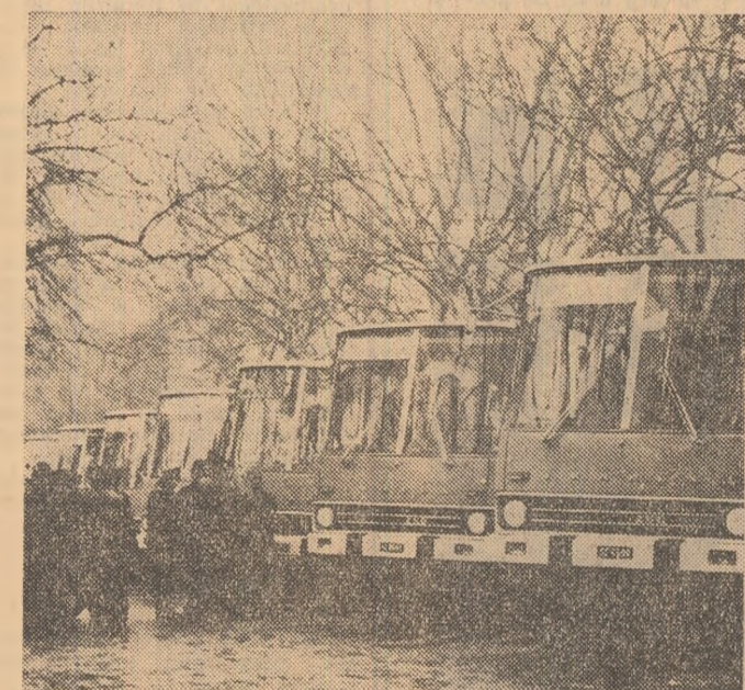
R. P. UNGARĂ. — Un nou lot de autobuze „Ikarus” gata de a fi expediat beneficiarilor.