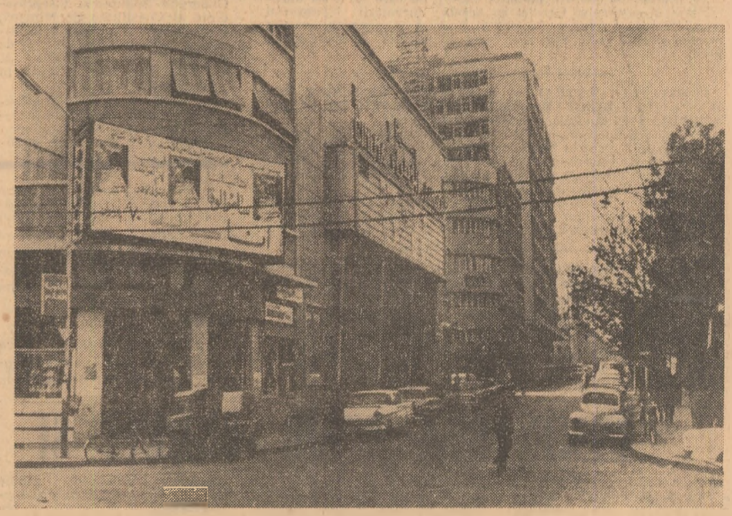
Imagine din capitala Republicii Arabe Siriene — Damasac.

ALGER. Referindu-se la o eventuală întîlnire între țările occidentale consumatoare și țările producătoare de petrol, pre-