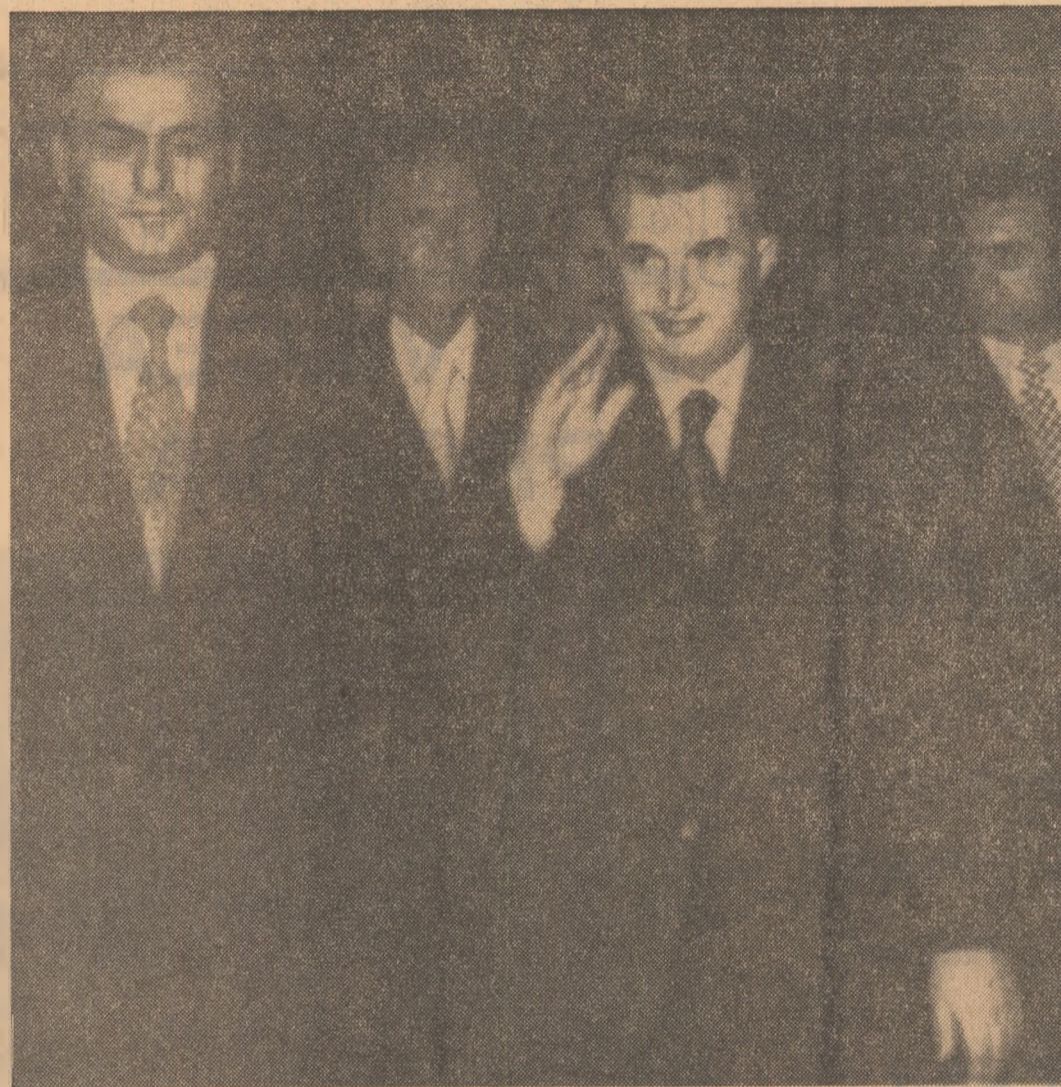
„Fiți bine venit în mijlocul nostru, mult stimat domnule președinte Nicolae Ceaușescu”. Cu aceste cuvinte a fost întâmpinat președintele Consiliului de Stat al Republicii Socialiste România de către colectiul companiei aeriene libaneze.

ANUL XXX, SERIA II, Nr. 7695 6 PAGINI—30 BANI SIMBĂȚĂ 16 FEBRUARIE 1974