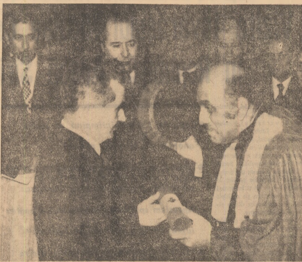
prezenți. Apoi, în saloanele universității, președintele Consiliului de Stat al României primește felicitări din partea celorlalte personalități ale vieții științifice și culturale, din partea studenților, se întretine cordial cu persoanele prezente la solemnitate.

Cuvântul președintelui Nicolae Ceaușescu a fost subliniat în repetate rânduri cu aplauze îndelungate de toți cei