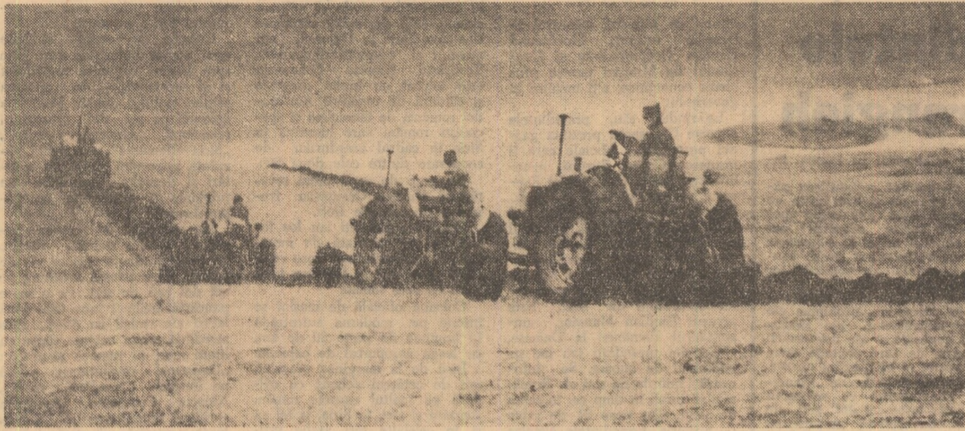
La Dănești, județul Harghita, au început arăturile de primăvară.

Cooperatorii și mecanizatorii au lucrat ca într-o zi de primăvară. Constanțeni, arădeni, erceeni și dolheii au executat în această duminică arăturile pe ultimele suprafețe neogorite în toamnă, legumicultorii au semănat pe ultimii mp de răsadnițe calde, s-a fertilizat, s-a lucrat canalele de irigații și desecări, în 20 de județe ale țării s-a semănat. S-a semănat mazărea și borșoagurile. Și nu numai atât — s-a continuat în ritm obișnuit primăvara pregătirea suprafețelor în vederea însămânțării celorlalte culturi din prima urgență. Peste tot unde s-a putut lucra, în timp ce ieșit uteciștii, mecanizatorii, cooperatorii, elevii și muncitorii naționali. A început drumul pământului. Se muncete intens, se fac lucrări de calitate, nici un strop de apă nu trebuie să se piardă. Organizarea și retribuirea muncii în acord global se dovedește deosebit de stimulatoare în activitatea cooperativelor și mecanizatorilor, iar între acțiunile ample se numără și aceea a transformării duminicii de ieri în zi obișnuită de lucru de către peste 1 milion de lucrători din agricultura țării. Redând fațete de muncă de pe cântec șantierelor de lucru ale zilei.