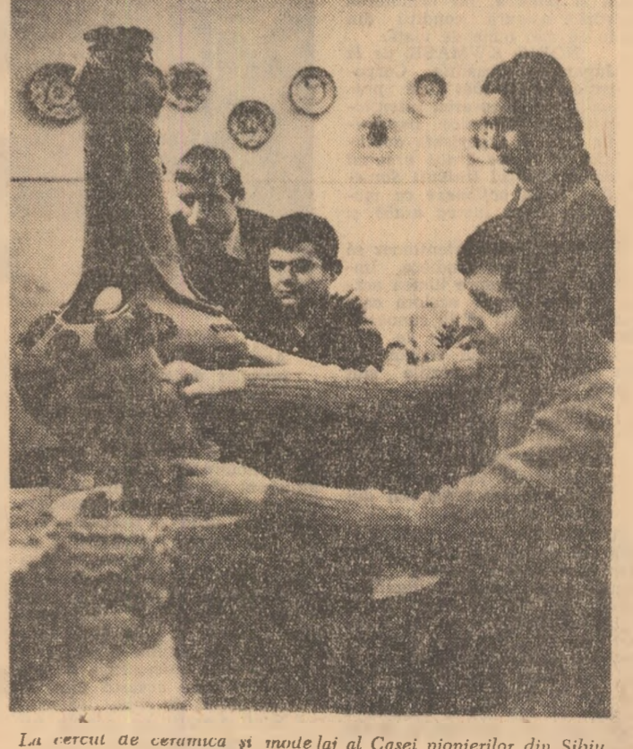
La cercut de ceramica și marelaj al Casei pionierilor din Sibiu.