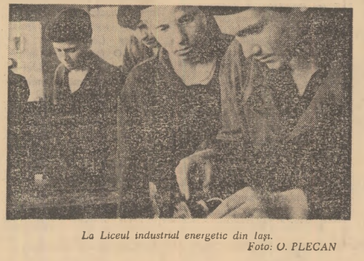
La Liceul industrial energetic din Iași.