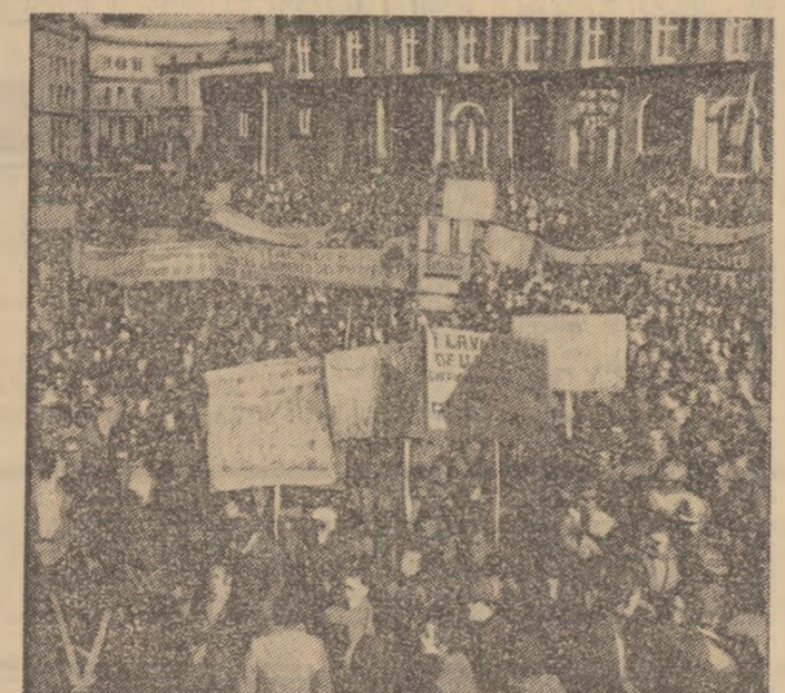
ITALIA: La Napoli a avut loc o manifestație a oamenilor muncii pentru îmbunătățirea condițiilor de viață și de muncă.

viziunii pakistaneze, Aziz Ahmed, ministru pentru problemele externe al Republicii Islamice Pakistan, referindu-se la problematica conferinței de la Lahore, a arătat că ea va privi, în principal, „reglementarea justă și echitabilă a conflictului din Orientul Apropiat și al statutului legal al populației palestiniene”. „Nu numai țările arabe, ci și toate celelalte țări islamice sint interesate în găsirea unei soluții juste pentru aceste probleme”, a spus Aziz Ahmed. În afara acestor aspecte, diferite forme de cooperare între țările participante la conferință ar putea face obiectul dezbaterilor, ele fiind posibile, dorite și necesare, a adăugat ministrul de externe pakistanez.