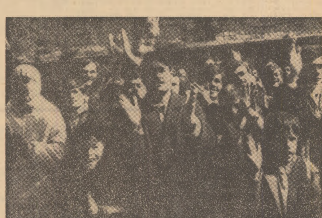
Prețuridendi, pe itinerarul pe care s-a desfășurat cea de a doua zi a vizitei, orașul Damasc a fost martorul unor emoționante manifestații. Șeful statului român a fost ovaționat cu deosebită căldură de cetățeni, expresie a sentimentelor de înaltă prețuire și respect față de conducătorul României socialiste.