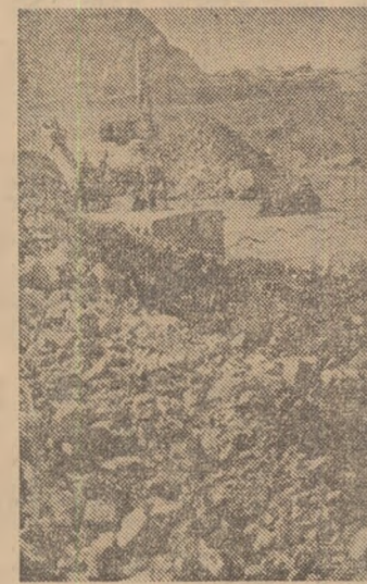
R. D. VIETNAM: Exploatarea carboniferă la zi Deo Nai

rale, integrarea activităților de turism în dezvoltarea social-economică a fiecărei țări, introducerea unor forme noi de concurență între factorii naționali și organismele internaționale în domeniul transporturilor destinate să contribuie la îmbunătățirea relațiilor de transporturi pe continent.