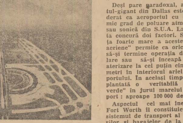
Imagine a aeroportului Fort Worth: o „poartă aeriană” pentru secolul viitor...

Noua „poartă aeriană” texană se înfățișează pe o suprafață de 70 de kilometri pătrați și în instalațiile ei complexe nu pot fi cuprinse, în ansamblu, cu privire decât din avionul sau elicopterul în zbor. Cele două piste duble principale de aterizare-decolare, cu o lungime de 4 kilometri fiecare