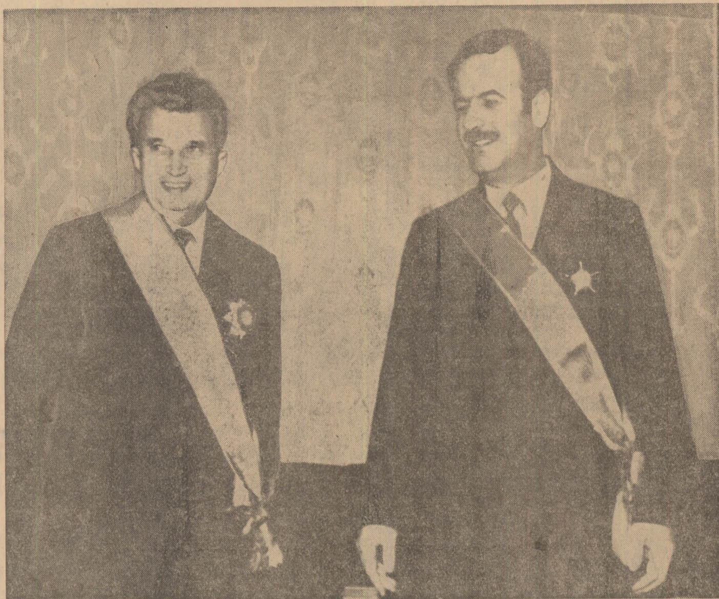
Președintele Nicolae Ceaușescu și președintele Hafez Al-Assad după ceremonia înmînării unor înalte distincții care a avut loc în cursul zilei de luni la Palatul prezidențial din Damasac

Vă rog, domnule președinte, să binevoiți a accepta urările mele sincere de fericire și sănătate, pentru dumneavoastră personal, de progres continuu și prosperitate pentru poporul român prieten.