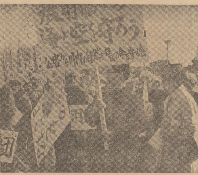
JAPONIA: Demonstrație a pescarilor din Kagoshima împotriva poluării apelor.

Experții precizează că la originea acestor teme se află intenția statelor membre ale Pieței comune de a ridica prețul oficial al aurului, în cadrul tranzacțiilor dintre ele, la un nivel mai apropiat de cel al pieței libere, precum și neîncrederea tot mai accentuată în monedele de hirtie. Acest din urmă factor s-a făcut simțit prin menținerea cursului metalului galben la nivelurile ridicate așine luni. La Paris, dolarul a coborât, atât pe piața comercială (oficială) cît și pe cea financiară (accesibilă turșilor), sub paritatea în vigoare în a doua devalorizare a sa, operată în februarie 1973. De la cursurile de 4,98 și 5,08 franci existente luni seara în cursul tranzacțiilor din operațiunile militare din octombrie 1973 și faptelor de arme ale soldaților egipțieni. Discursul președintelui Sadat a fost urmat de o expunere a ministrului de război Ahmed Ismail, în legătură cu același eveniment. La încheierea reuniunii au fost decorați și avansați în grad un mare număr de militari.