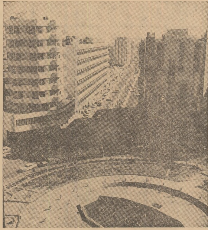
IRAK: Imagine din Bagdad

A fost semnat, de asemenea, protocolul de colaborare pe anul 1974.