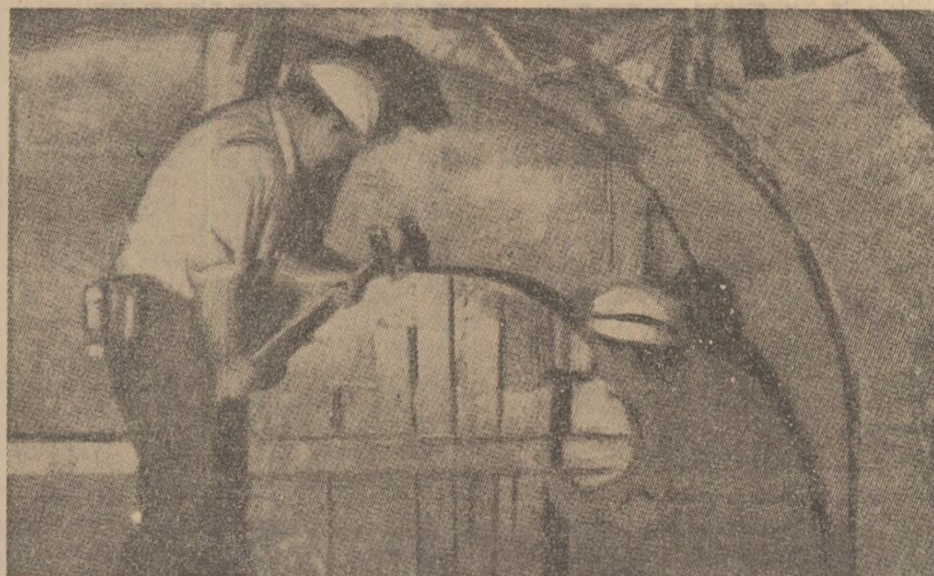
ANGLIA: Mineri din Derby în chid gura unui pui pentru a evita pericolul unor explozii în timpul grevei

Lucrările se concentrează asupra abordării concrete a problemelor legate de redactarea documentelor finale