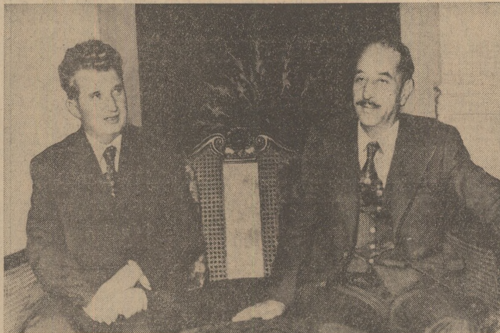
Aspecte din timpul vizitei protocolare și de la sosirea pe aeroportul din Bagdad.

● La Muzeul irakian, unul din așezămintele de cultură ce adăpostesc cele mai valoroase vestigii ale istoriei popoarelor ce au locuit, de-a lungul secolelor, în regiunea situată între Tigru și Eufrat. ● „Apreciez preocupările și rezultatele specialiștilor și istoricilor, care asigură păstrarea și punerea în valoare a unor monumente și piese rămase de la civilizațiile ce s-au succedat pe pământul Irakului de azi. Le doresc ca cercetările lor să fie încununete de noi succese”, a scris președintele Nicolae Ceaușescu în Cartea de onoare a Muzeului irakian. ● Într-o manifestare impresionantă, de neuitat, cetățenii Bagdadului îl salută cu deosebită căldură pe tovarășul Nicolae Ceaușescu: „Trăiască Ceaușescu, trăiască România!”, „Bagdadul te salută, frate și tovarăș președinte!”