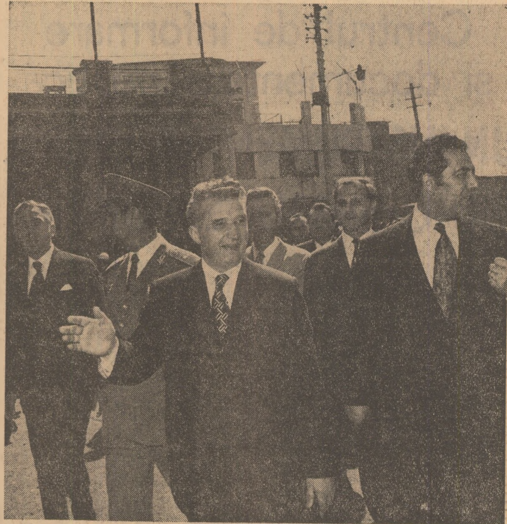
Pe bulevardul Harun Al Rașid din capitala irakiană, Bagdad, oraș în care arhitectura modernă se îmbină într-o atmosferă caracteristică cu stilul clasic arab