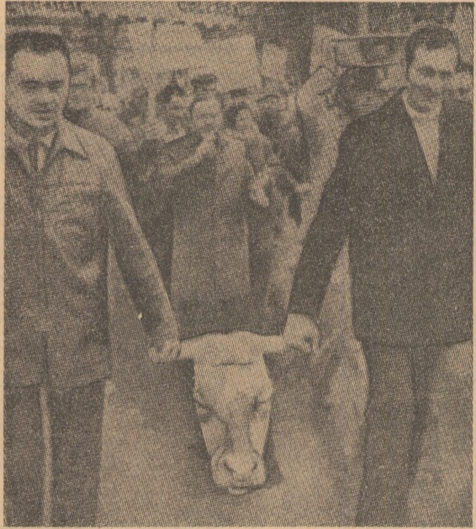
FRANȚA. — Demonstrație a unor țărani, împotriva politicii agricole a Pieței comune.

● ÎNTRU 19 și 21 februarie, la Dubna s-au desfășurat lucrările sesiunii Comitetului reprezentanților împunătorici ai guvern-