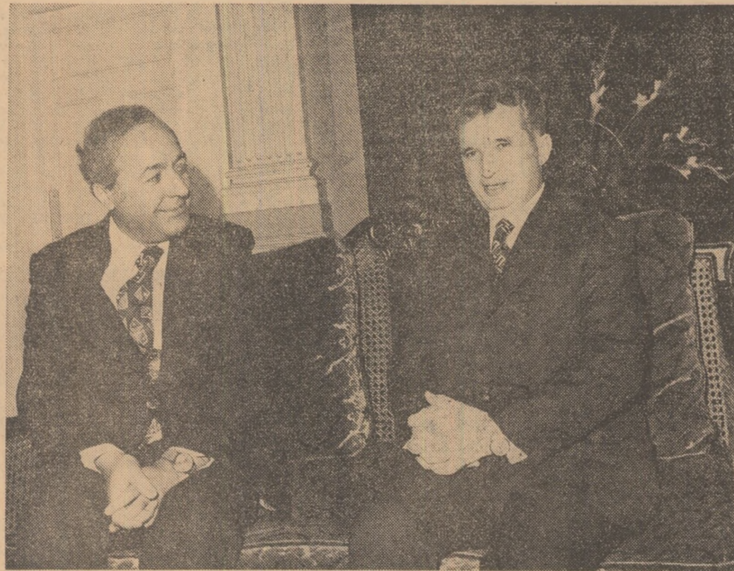
Aspect de la întîlnirea dintre tovarășul Nicolae Ceaușescu și Aziz Mohamed, prim-secretar al Comitetului Central al Partidului Comunist Irakian

NICOLAE CEAUȘESCU, Președintele Consiliului de Stat al Republicii Socialiste România