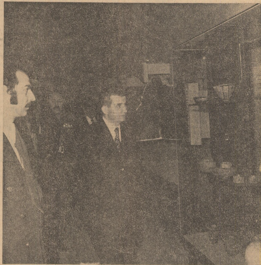
Este vizitat Muzeul irakian unul din așezămintele de cultură ce adăpostesc cele mai valoroase vestigii ale istoriei popoarelor ce au locuit, de-a lungul secolelor, în regiunea situată între Tigru și Eufrat.

Secretarul general al Partidului Comunist Român, președintele Consiliului de Stat al Republicii Socialiste România, Nicolae Ceaușescu, a reînnoit invitația adresată secretarului general al Conducerii Regionale a Partidului Socialist Arab Baas, președintelui Republicii Irak, Ahmed Hassan Al-Bakr, de a face o vizită oficială în România. Invitația a fost acceptată cu plăcere, data vizitei urmînd a fi stabilită ulterior pe cale diplomatică. Bagdad, 21 februarie 1974