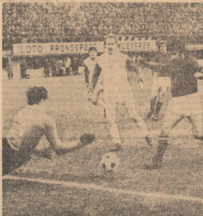
Fotbal: XVIII DEBUTUL PROMITE