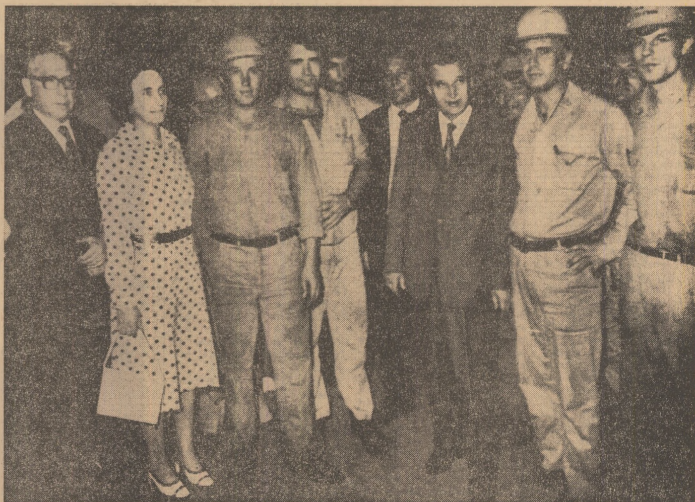
Printre muncitorii combinatului siderurgic Somisa.