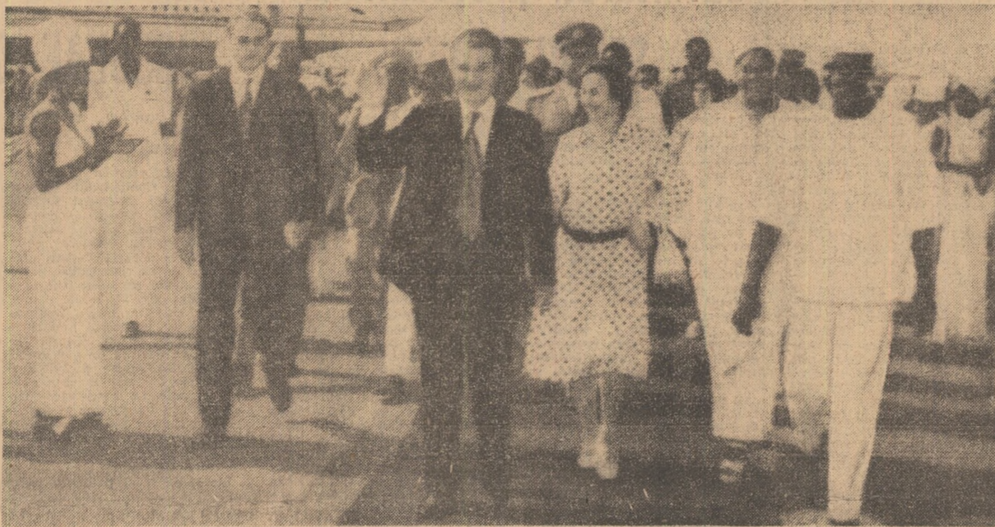
La sosire, pe aeroportul internațional „Gbessia” din Conakry