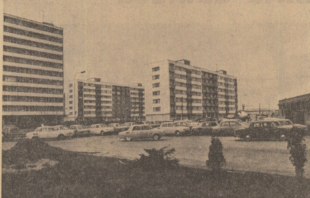
R.S. CEHOSLOVACA. Blocuri noi de locuințe în orașul Mlada Boleslav