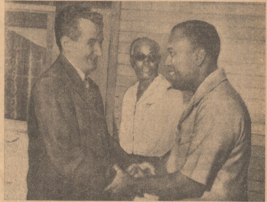
Relatarea întîlnirii în pagina a III-a