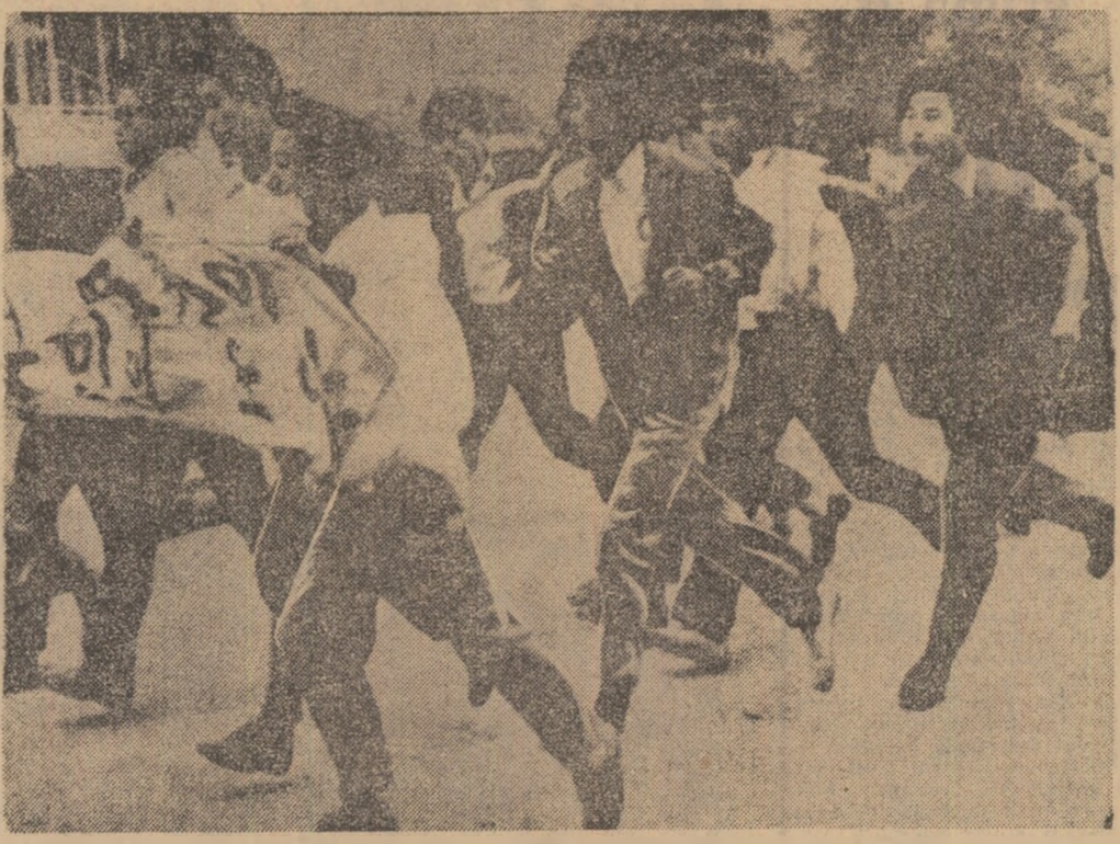
COREEA DE SUD: Aspect de la o demonstrație a studenților din Seul pentru democratizarea universității.

Președintele Venezuelei, Carlos Andrés Pérez, a anunțat, în cursul unei conferințe de presă, formarea unei comisii guvernamentale în sarcinile cu studiarea naționalizării industriei petroliere a țării. În discursul său inaugural, rostit la 12 martie, președintele declarase că unul din obiectivele guvernului va fi naționalizarea industriei petroliere. Concesiunile acordate companiilor străine — care cotrolează 95 la sută din operațiunile de extragere și prelucrare a petrolului venezuelean — ar urma să expire, potrivit unei legi adoptate în urmă cu doi ani, în 1983. În cadrul conferinței de presă, președintele a accentuat că „Venezuela nu poate aștepta încă zece ani pentru definirea politicii sale petroliere”.