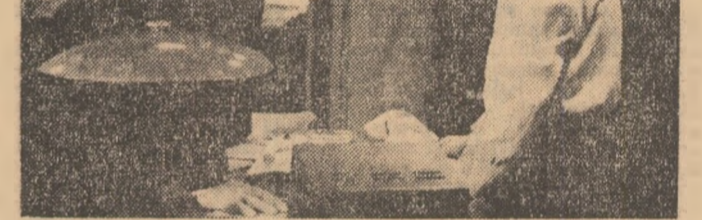
Filmelor noastre de actualitate li s-a reproșat adesea înclinația eufemistică de a trata tema fabricii și a șantierului. Nu poate fi vorba de o astfel de obiectie în cazul filmului „Proprietari”...