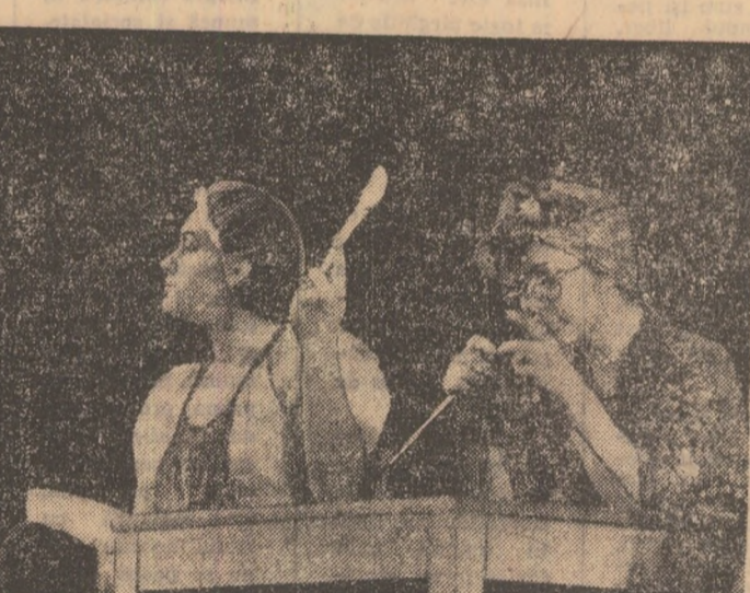
„Experimental Quartet”.