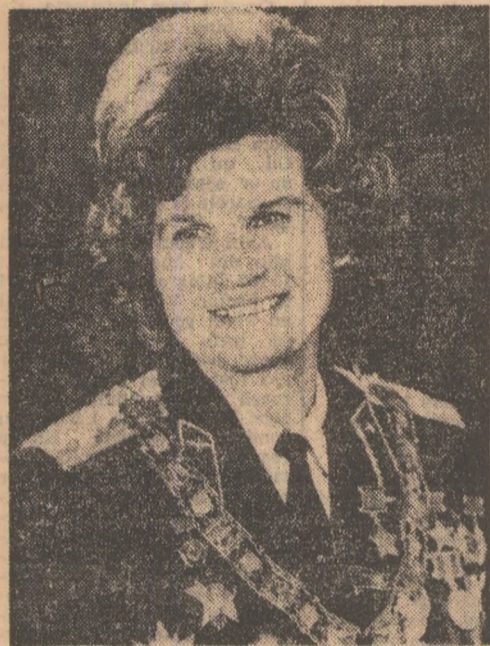
Valentina Nikolaeva Tereșkova

Prima femeie cosmonaut din lume s-a născut la 6 martie 1937, în satul Maslennikov din regiunea Iaroslavl, într-o familie de colhoznici. În copilărie a visat să devină mecanic de locomotivă, dar a devenit muncitoare textilă. A lucrat la Combinatul „Krasnii Perekop” din Iaroslavl. În 1960 a terminat cursurile fără frecvență ale Institutului de textile. În timp ce era elevă la școala tehnică a început să se ocupe și de parașutism. La 16 iunie 1963, Valentina Tereșkova și-a luat startul cu nava cosmică „Vostok-6”, înconjurând Pământul de 48 de ori. În 1969, colonela Valentina Nikolaeva Tereșkova, zălog al Uniunii Sovietice, a absolvit Academia militară „N. Jucovski” obținând titlul de inginer pilot cosmonaut. Pe lângă obiectele de așezare, o miltantă de seamă — președinta a Comitetului Femeilor Sovietice, deputată în Sovietul Suprem al U.R.S.S.