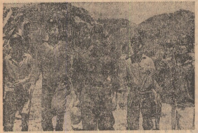
Tinerii acștia de la Vang Danh poartă cu succes bătălia creșterii producției de cărbune.

S-a deschis un nou capitol al zbucnitaților istoriei a Vietnamului. Neînfricabilii luptători pentru apărarea patriei, acesti minunati oameni care au conferit spiritului de sacrificiu dimensiuni fără precedent, s-au angajat în ampla bătălie pentru