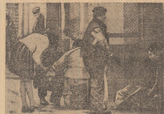
IRLANDA DE NORD: O nouă recrudescență a actelor de violență la Belfast

● SUB CONDUȘTEREA pe ședințele Ernesto Geisel, în capitala braziliană a avut loc prima reuniune a noului guvern, în cadrul căreia au fost examinate, în principal, direcțiile de orientare a politicii țării în următorii cinci ani, punându-se accentul pe problemele prioritare. Nou șef al statului a arătat, în cuvântul său, că Brazilia intenționează să continue politica