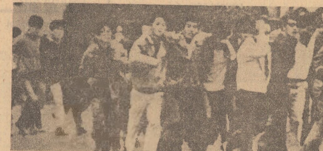
Aspect de la o demonstrație a studenților din Seul (Coreea de sud) pentru reforma universitară și libertăți democratice.