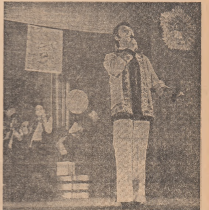
Simbota seara, la Modern-club din Capitală, cîteva sute de tineri au cîntat la seara „Scinței tineretului”. Asupra programului, ambianței, calității participării și a receptivității spectatorilor, vom reveni în numerele următoare ale ziarului.