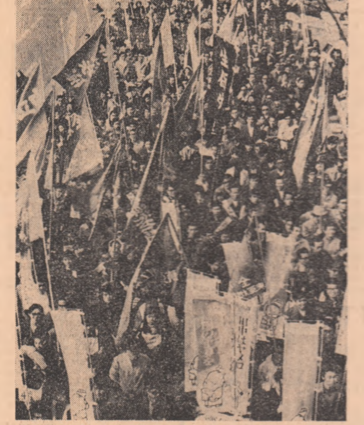
JAPONIA: Aproximativ 300 000 de locuitori ai capitalei nipone au participat recent la un miting împotriva inflației.

Totodată, rezoluția definește sarcinile actuale ale Frontului Patriei din Vietnam, între care un loc de frunte revine mobilizării maselor la consolidarea în toate domeniile a R.D. Vietnam, parțială cu concentrarea tuturor forțelor în lupta pentru aplicarea strictă a Acordului de la Paris privind Vietnamul.