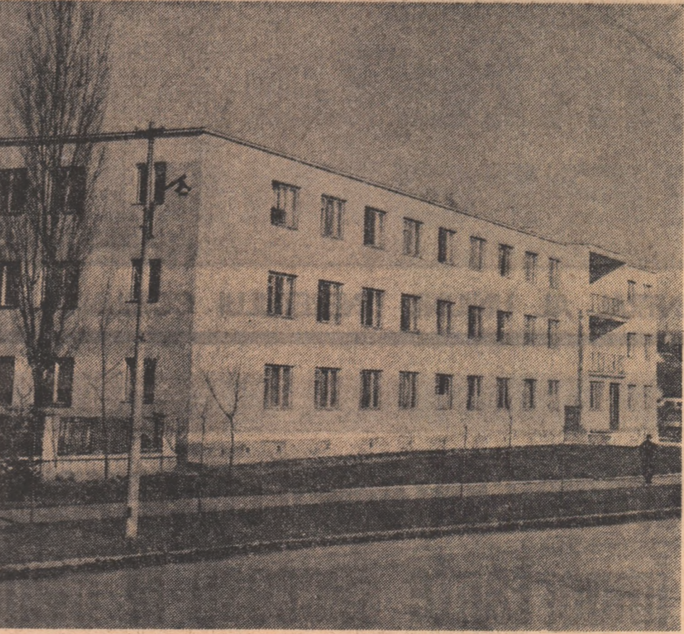
Intreprinderea „Independența” din Sibiu, căminul muncitoresc.