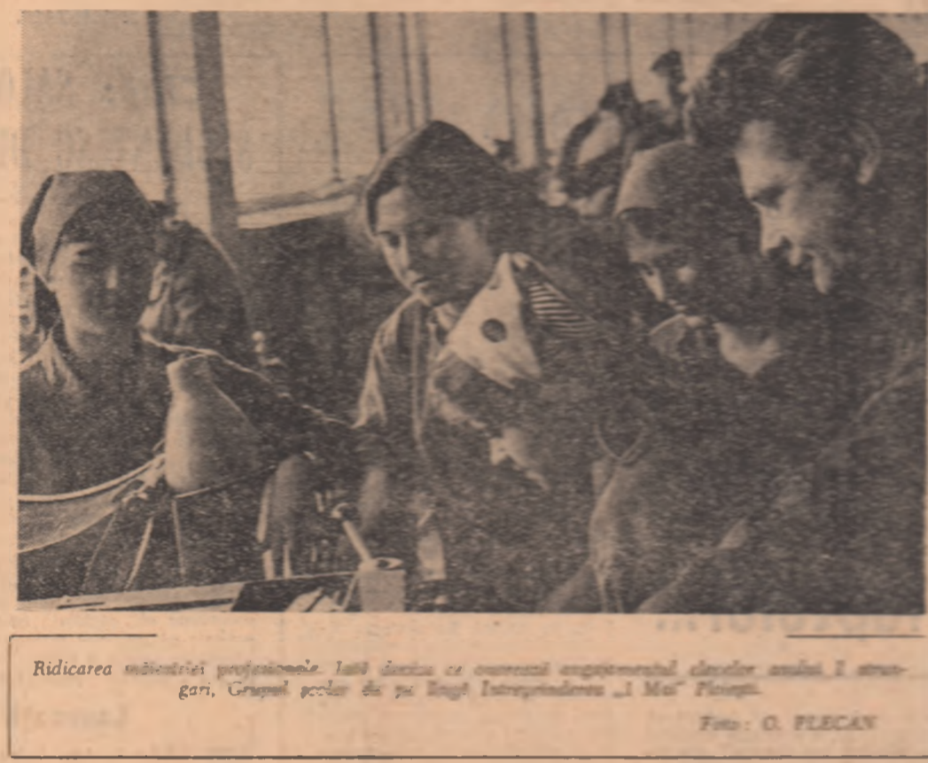
Ridicarea măștii profesionale. Tânăra din stânga este o tânără angajată, din stânga, Grupul școlii de pe lângă Întreprinderea „1 Mai” Florin.

● La tinăra Întreprindere de utilaje și piese de schimb pentru industria ușoară din Botoșani a început montajul primului lot de zece războaie de țesut din cele 200 planificate a se realiza aici în prima jumătate a anului.