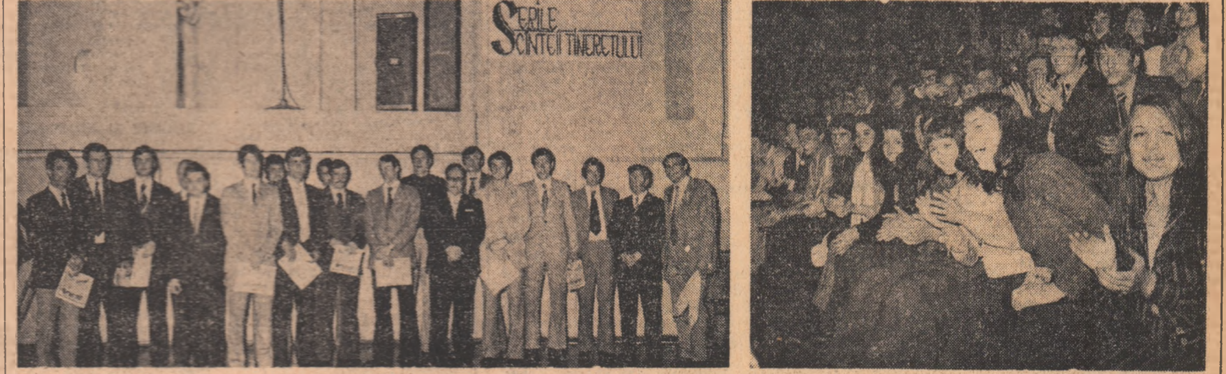
Relatarea pe larg a momentelor serii în numărul nostru de luni

O atmosferă entuziastă și un punct deosebit de important din program: CAMPIONILOR LUMII LA HANDBAL LI S-A DECERNAT „DIPLOMA DE ONOARE” A C.C. AL.U.T.C.