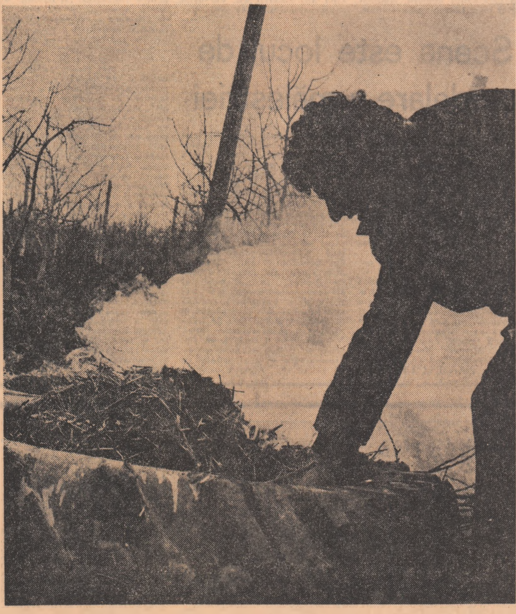
La ferma pomicolă a C.A.P. Colanu, din județul Dimbovița, se combate înghețul și brumele căzute în aceste zile.

Lucrările noilor obiective zootehnice au fost încredințate grupului de șantier pentru construcții de acest gen din Galați.