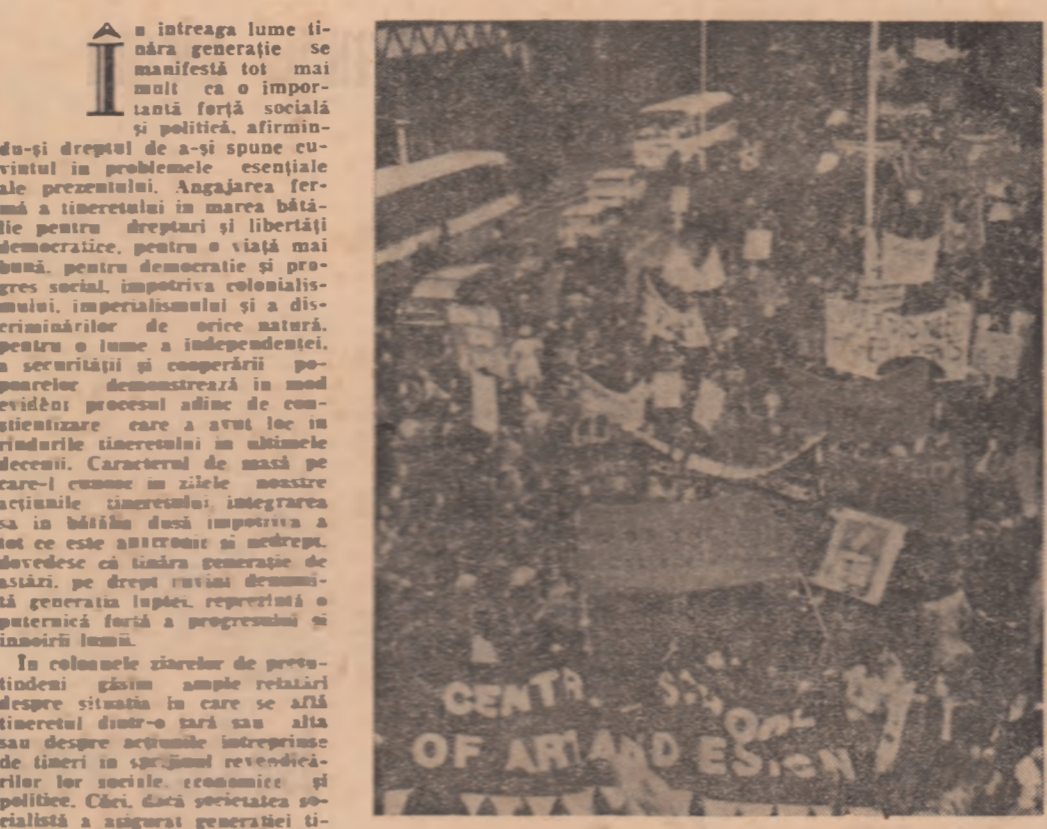
Demonstrație a studenților britanici împotriva majorității taxelor universitare.

În întreaga lume tineră generație se manifestă tot mai mult ca o importantă forță socială și politică, afirmându-și dreptul de a-și spune cuvântul în problemele esențiale ale prezentului. Angajarea fermă a tineretului în marea lăută pentru drepturi și libertăți democratice, pentru o viață mai bună, pentru democrație și progres social, împotriva colonialismului, imperialismului și a discriminărilor de orice natură, pentru o lume a independenței, a securității și cooperării pozitive demonstrează în mod evident procesul dinamic de constituire care a avut loc în rândurile tineretului în ultimile decenii. Caracterul de masă pe care-l cunoaștem în zilele noastre acțiunile tineretului, integrarea sa în bătălia deosebită a conștientizării care a avut loc în rândurile tineretului, mă dovedește că tineră generație de astăzi, pe drept cuvânt denumită generația luptei, reprezintă o puternică forță a progresului și înnoirii lumii.