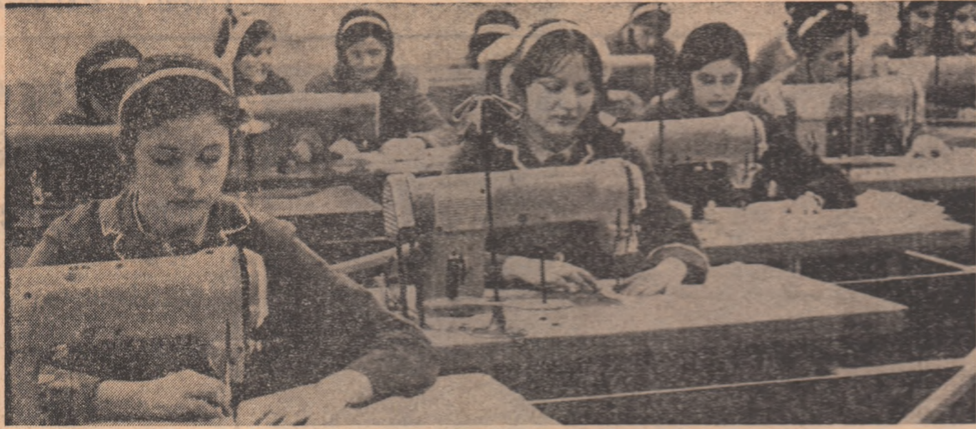
În atelierul de confecție îmbrăcăminte al Școlii profesionale M.I.U.-Oradea.