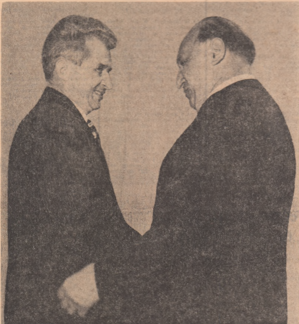
Imagini semnificative pentru atmosfera de prietenie, cordialitate și înțelegere reciprocă în care s-a desfășurat vizita.