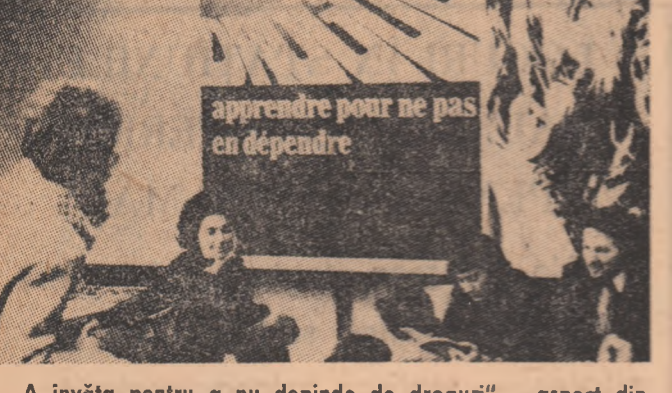
„A învăța pentru a nu depinde de droguri” — aspect din timpul unei întâlniri cu tinerii organizați de Comisia preventivă din Geneva.

farmaceutice, halucinozene și barbiturice. În această situație este îngrijorător faptul că statisticile oficiale din Statele Unite, de exemplu, arată că principala cauză a creșterii criminalității o reprezintă utilizarea narcoticelor. Astfel, mii de tineri care recurg la droguri pentru a vedea „viața în roz” se trezesc în saloanele clinicii speciale pentru dezintoxicare sau în spatele grătilor sub acuzația de crimă. Se știe că de greu poate fi vindecat cineva care este atins de „beția albă”, cum mai este numit consumul de stupefianțe. De aceea guvernele țărilor în care traficul și consumul de droguri reprezintă flagelul numărul 1,