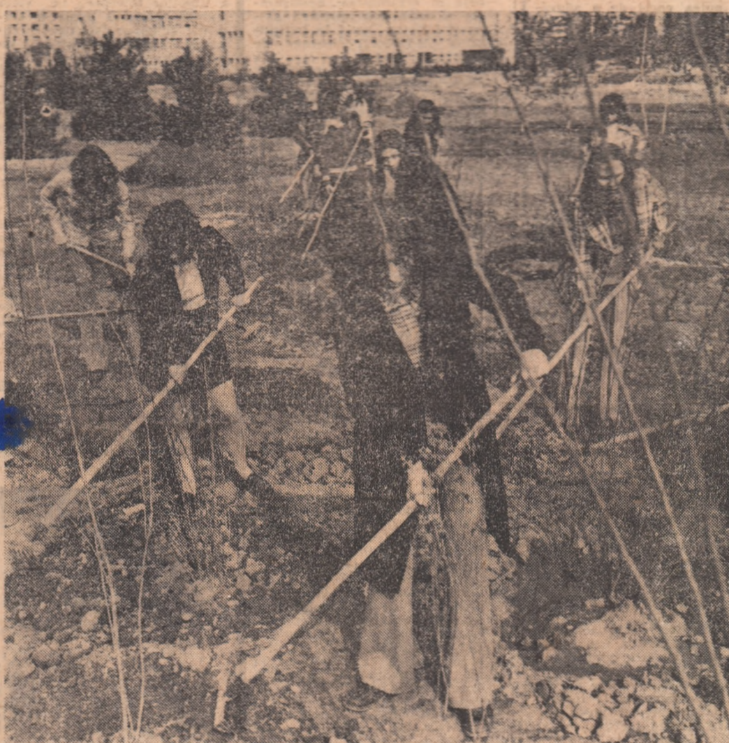
Hărnicie și entuziasm tineresc la acțiunile de muncă patriotică, din cartierul Titan