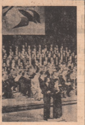
documentare „București '74”, deschisă în holul Teatrului Național, și al spectacolului festiv „București, oraș al împlînirilor”, găzduit de aceeași prestigioasă instituție.

Programul primei zile a săptămîinii „Primăvara culturală bucureșteană”, desfășurat sub deviza „București — anul XXX”, a cuprins evocarea „Păinii de lupă” din istoria mișcării muncitorești bucureștene”, simpozionul „Insurecția națională antifascistă armată din august 1944, în București”, spectacolul de estradă „Bucureștii de ieri — Bucureștii de azi”, prezentat de Teatrul satiric-muzical „C. Tănase” la clubul Întreprinderii „Republica”, antologia-spectacol „Anton Pann — cronicar al cetății” (Muzeul de istorie a municipiului București), spectacolele evocatoare susținute de artiștii amatori la case de cultură, cluburi și cămine culturale și alte manifestări. În încheiere, un numeros public a participat la vernisajul expoziției