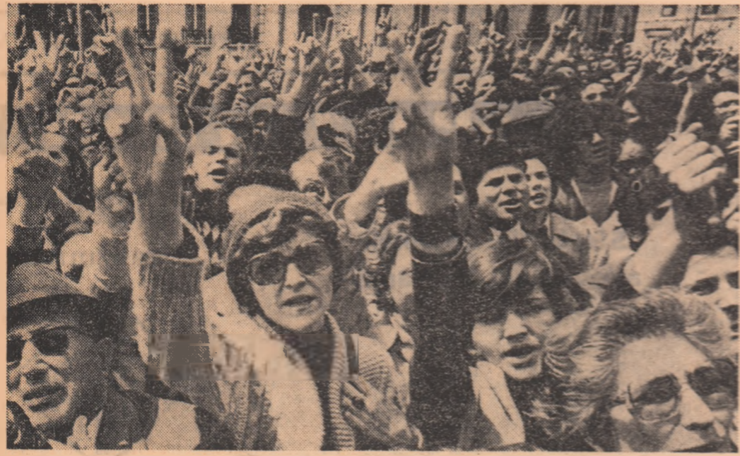
Imaginea aceasta reflectă bucuria cu care populația Lisabonei salută doborârea regimului salazarist.