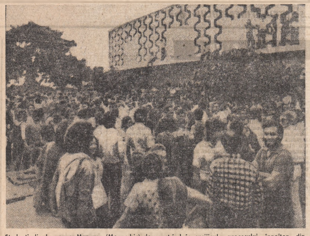
Studenți din Laurence Marques (Mozambic) de îmbrățișând în sprijinul procesului înnoitor din Portugalia.

GUVERNUL Revoluționar al Republicii Cuba a anunțat încheierea de alegeri pentru organele de putere populare ce urmează să fie create la nivel municipal, rațional, provincial și național.