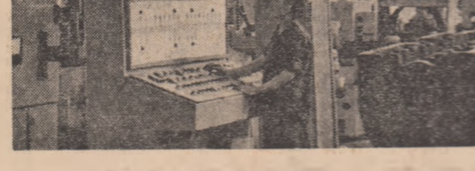
R. P. D. Coreeană. — Imagine de la Uzina de fracționare Keumseung, unitate frunzoasă a industriei construcătoare de mașini.