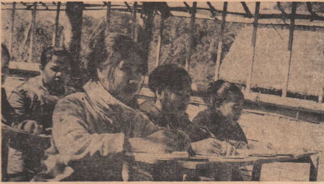
LAOS: Oră de curs la o școală pedagogică din provincia Sam Neua.