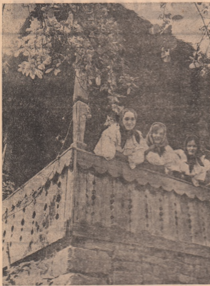
Maramureș, țara cecilor / cu mândrită-a grad de ceteri. / cu teaciori fără pereche. / cu corbe ca mandele. / cu oști cu înșelăciune.