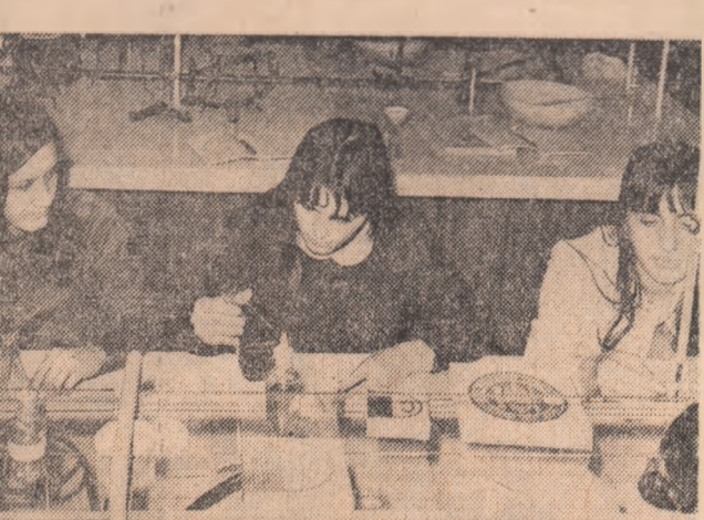
Pregătiri pentru sesiunea de examene în laboratorul Facultății de horticultură a Institutului Agronomic din București

La Tehnic-clubul nereșit care acțiunea unui climat cât mai favorabil. Sesiunea a mijlocit un bogat schimb de opinii între actualii și viitorii specialiști. Această manifestare științifică a relevat capacitatea de creație a tinerilor ingineri și studenți, continuarea lor pentru cercetare în cele mai stricte probleme ale producției.