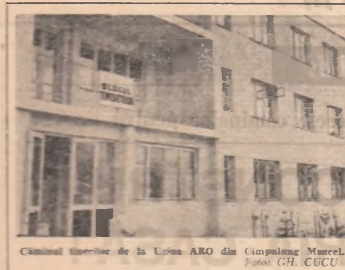
Căminul tinerilor de la Urziceni ARO din Cimpulung Mare.