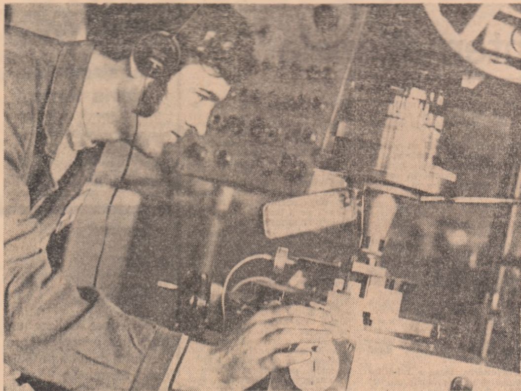
Printre tinerii de la Intreprinderea „Electromiș”-Timișoara, care lucrează la mașinile de rectificat...

Cu o lună în urmă n-am făcut constatari prea îmbucurătoare pe șantierele căminelor pentru tineret din municipiul Alba Iulia.