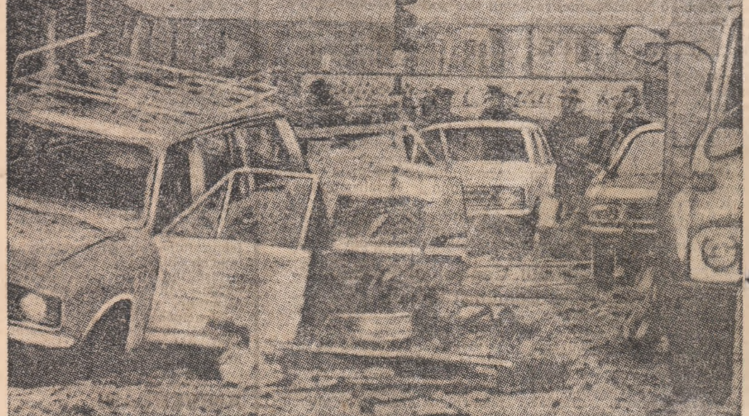
IRLANDA DE NORD. - Aspect din Belfast după recente explozii ce au provocat numeroase victime omenești.

Pe aceeași linie se înscriu și o serie de alte proiecte care prevăd naționalizarea industriei fierului — a doua bogăție naturală a Venezuelei ca importanță economică —