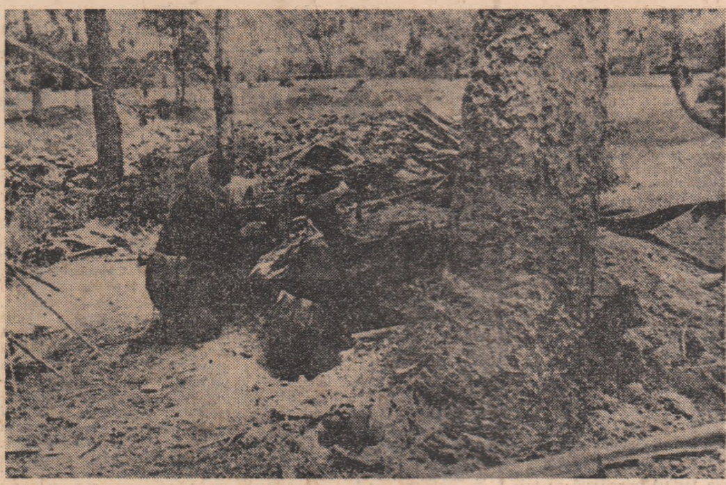
CAMBODGIA - O subunitate de tinere femei, aparținând F.U.N.C., în misiune pe frontul din Takor.

În 1966 părăsește guvernul și devine în mod oficial liderul fracțiunii majoritare a republicanilor „Independenți“, fracțiune care se va constitui curând într-un partid politic sub denumirea „Federația Națională a Republicanilor Independenți“.