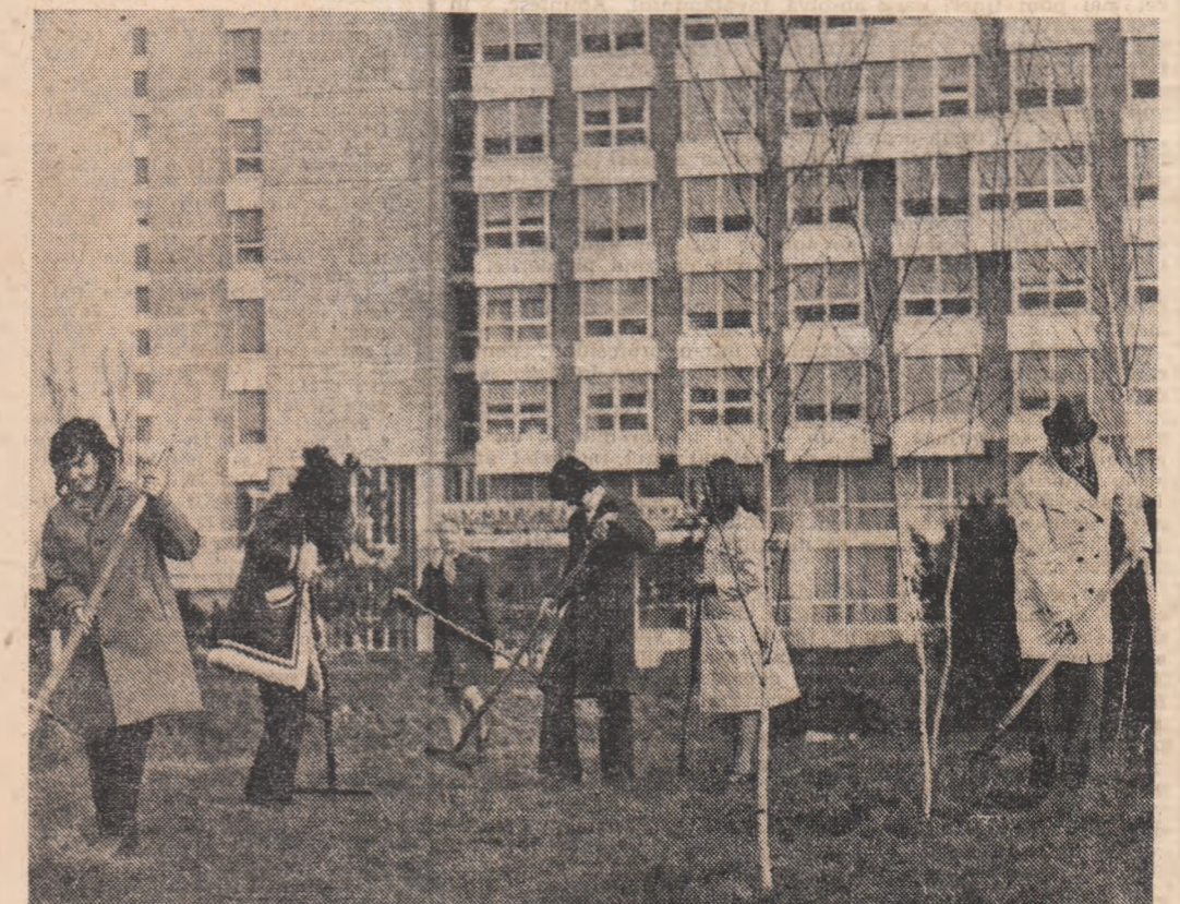
Gazde primitoare, tinerii din Mangalia Nord lucrează în ore de muncă patriotică la amenajarea spațiilor verzi din stațiune

la Mihăilești de altfel, a unor formații speciale mixte, alcătuite din cite un mecanizator și trei cooperatori care au în grădă cite 100 hectare teren. Colaborarea care este prezentă în cazul acestora este intr-adevăr demnă de urmat. Generalizarea unor asemenea experiențe condiționate, desigur, și de existența terribicilor, ca și a unui partener mai cuprinzător, nu poate fi decât foarte folositoare. Lucrându-se așa, cu responsabilități foarte precise, ar dispărea fără îndoială aprecierile care conțin pe acei „în general”, precieri care semnifică de altfel persistența unor carențe de ordin calitativ.