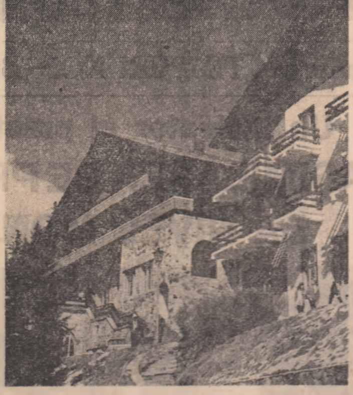
Din peisajul stațiunii climatice Păltiniș, județul Sibiu

Orice tînar își va găsi împlinirea într-o profesie pentru care este inclinat și și-a ales-o conștient, căreia înțelege să-și dedice neșovărit eforturile. Un om astfel realizat este valoros în primul rînd pentru că el însuși este activ, deoarece efortul său se conjugă, este un plus și nu un minus; un om capabil află într-un loc este de preferat unui incapabil aflat acolo datorită neconcordanței dintre ceea ce face și ceea ce a fost pus să facă; la care să mai adăuga și starea alertată venită a acelora care „nu trăiesc pe solul lor profesional” și, de aici, improvizarea pentru a se menține, apăsarea și chiar misfificarea.