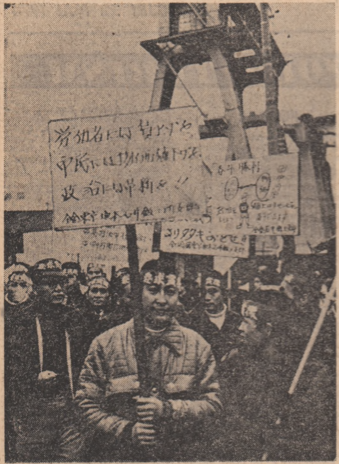
JAPONIA : Demonstrație revendicativă muncitorească la Tokio