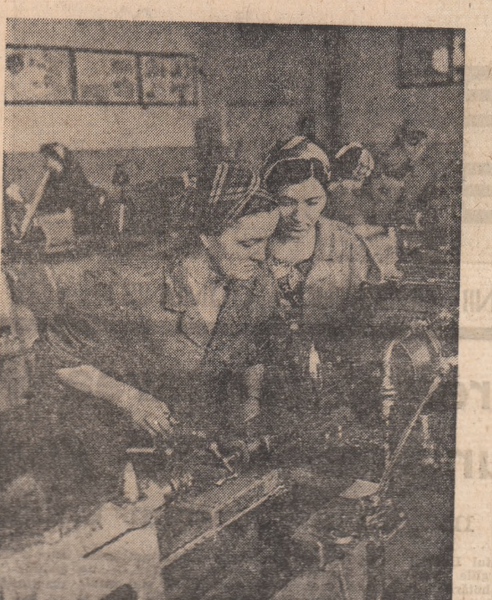
La școala cîntoarelor strungărițe.