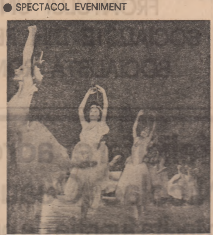
Ieri, pe scena Teatrului de operă și balet s-a susținut într-un ansamblu spectacolul...