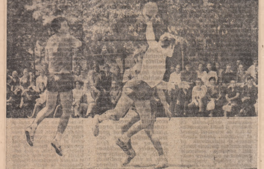
...Încă o fază din meciul de handbal Dinamo — Steaua s-a consumat.