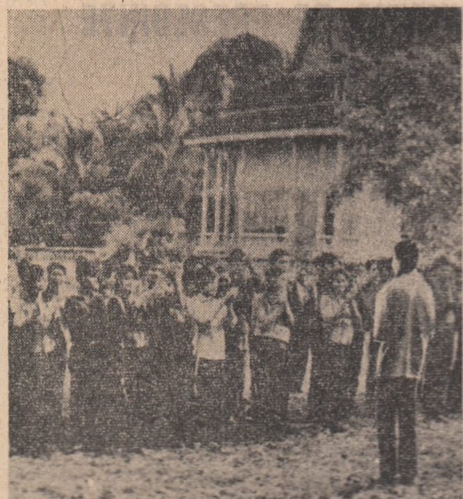
CAMBODGIA: Tineri patrioți din cadrul forțelor de eliberare după o reușită operațiune militară.

Intrevederile s-au desfășurat într-o atmosferă caldă, prietenească.