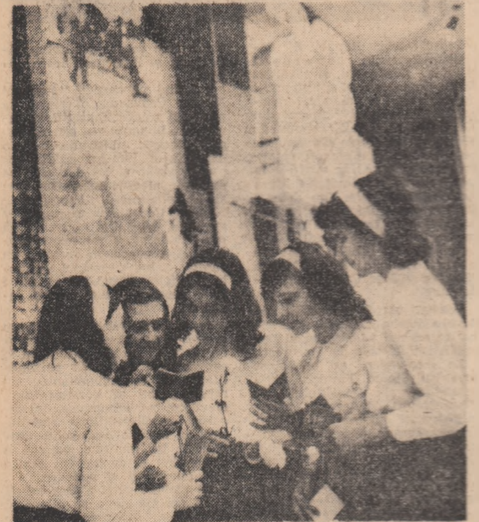
Festivitatea înmînării carnetelor U.T.C. în cadrul solemn al Muzeului de istorie a partidului comunist, a mișcării democratice și revoluționare din România a devenit o statornică acțiune în agenda vieții organizațiilor de tineret din școli. Iată în această imagine, cîteva utricule ale Liceului nr. 21, școlilor generale nr. 5 și 10 din Capitală, bucurîndu-se de noua investitură.