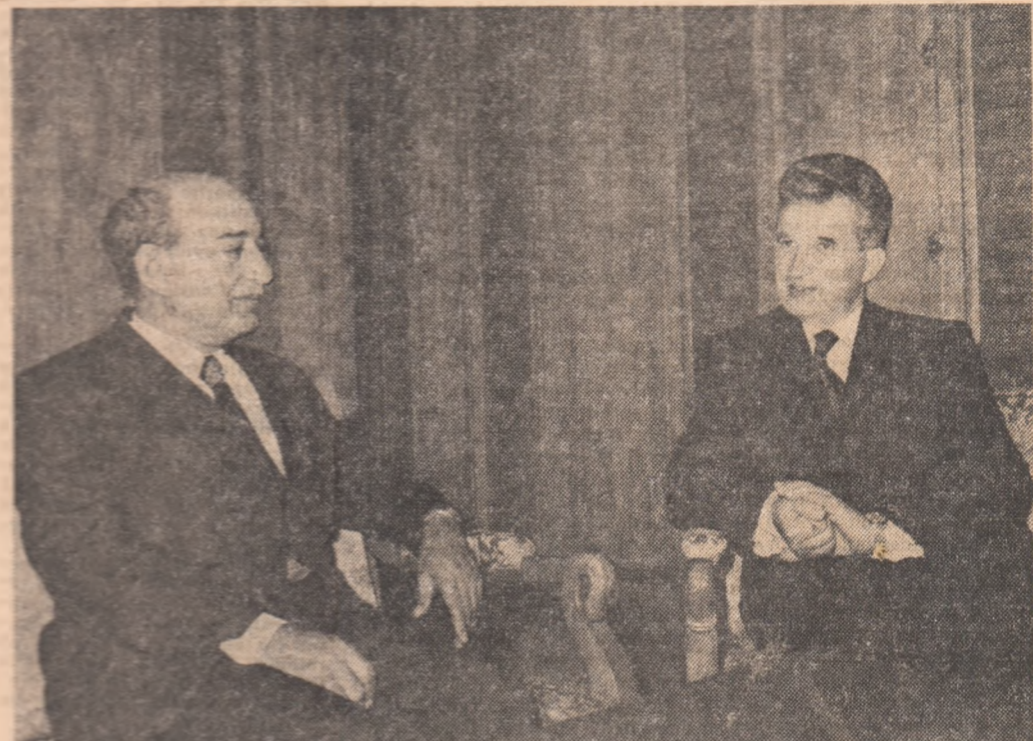
Președintele Republicii Socialiste România, tovarășul Nicolae Ceaușescu, a primit, vineri la ora 16, pe Mahmud Riad, secretarul general al Ligii Arabe, care face o vizită oficială de prietenie în țara noastră. Ca urmare a guvernării române.

● Secretarul general al Ligii Arabe, Mahmud Riad