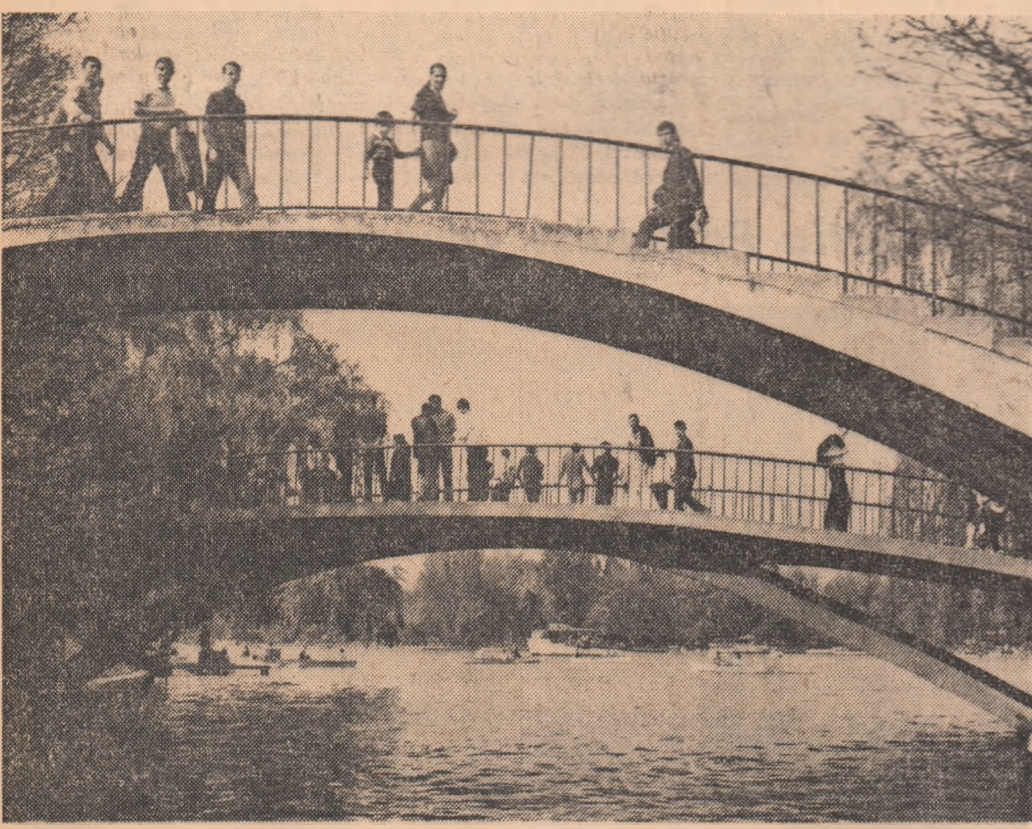
În Parcul Herăstrău