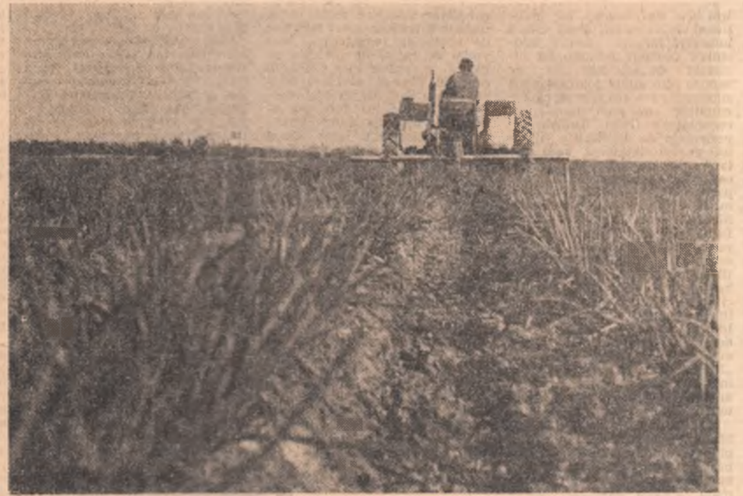
La Stațiunea experimentală de legumicultură de la Ișalnița, lucrările de prașit mecanic sînt în plină desfășurare