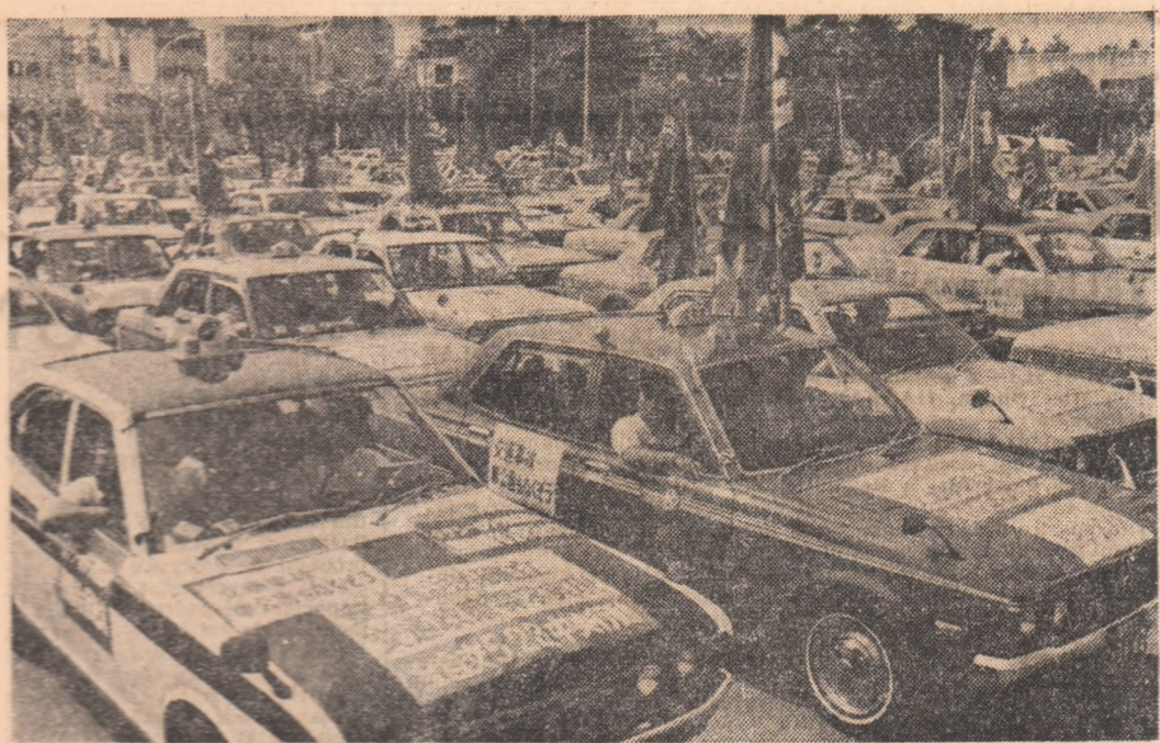
JAPONIA: Aspect de la un recent miting al șoferilor de taxi din Tokio...