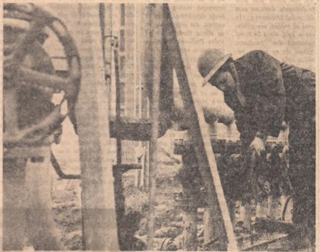
În verificarea, supravegherea și întreținerea instalațiilor — grijă deosebită, răspundere maximă.

P e harta municipiului Focșani a apărut nu demult un nou obiectiv industrial, o uzină care a și reușit să polarizeze privirile celor ce locuiesc pe aceste meleaguri. Întreprinderea de dispozitive, stație, mașini și scule așchietoare, căci despre ea este vorba, s-a și scris printre alte izvoare de permanență, atît de continuă lumina, atît de dese și roditoare pe pînăntul țării. Oamenii ei, în marea majoritate tineri, au vrut s-o cîntă mai repede pînă la urmă pentru economia patriei și au pus umărul alături de constructorii reușind astfel să dea în funcțiune prima capacitate de producție cu 7 luni mai devreme. Primul succes a fost obținut după cum se vede, înainte de existența oarecare vechime. Doi regișori nu fac altceva decît acordă asistență tehnică celor aflați în dificultate. Primii care primise de lucru la începutul schimbului sînt tineri. Așa se face că în câteva luni, numărul celor care nuși realizează norma este scăzut de trei ori.