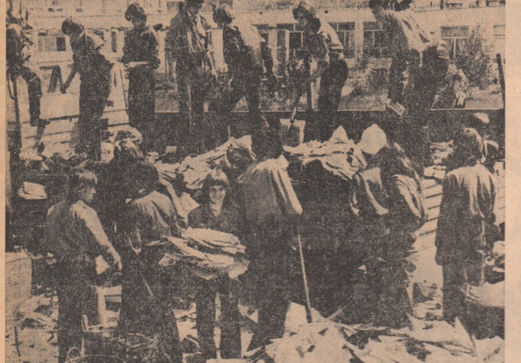
R. P. POLONA: Tinerii polonezi participă la o largă campanie națională de colectare și valorificare a deșeurilor de hirtie, metal și sticlă, cu scopul stringerii de fonduri necesare construirii, în apropiere de Varșovia, a unui „Centru pentru sănătatea copiilor”.