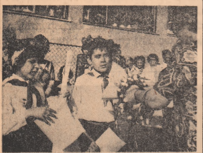
Moment emoționant. Festicitatea înmînării premiilor.

Primele trenuri au pornit spre vacanță. Drum bun!