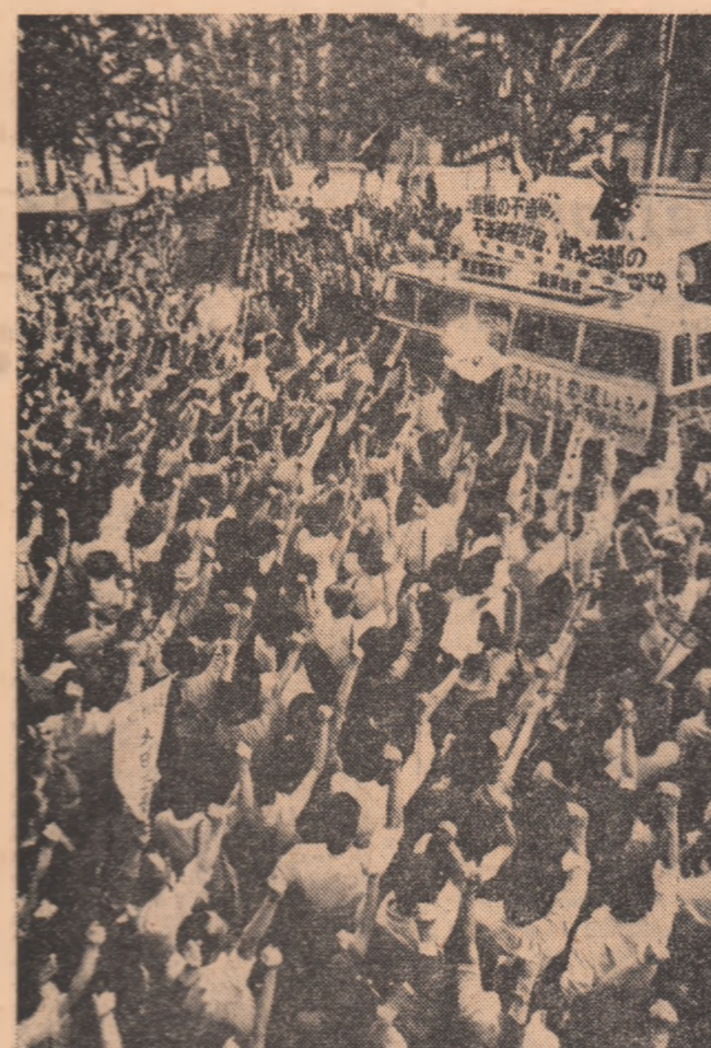
JAPONIA: Miting de protest la Tokio împotriva violării drepturilor organizațiilor sindicale.