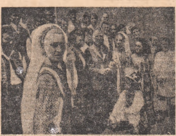
Membrii grupului folcloric român salutați cu multă căldură de primarul orașului Essen, Fritz Scheve (în centrul fotografiei) publicate cu acest prilej de WESTDEUTSCHE ALLGEMEINE ZEITUNG.

Ati la Braunschweig și la Essen, în aceste localități din apropierea capitalei vest-germane.