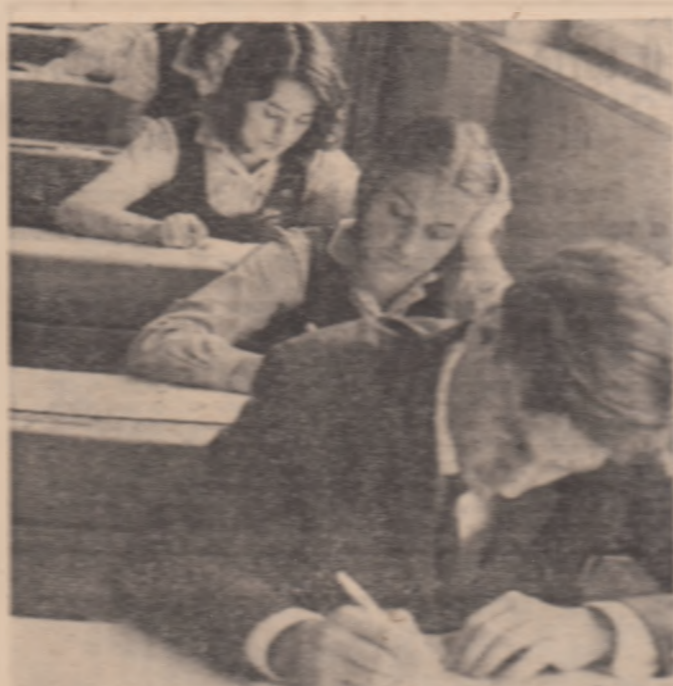
O scenă de mai de zile din sala de clasă dintr-un liceu din București...