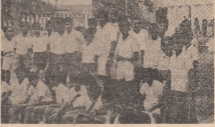
Sri Lanka - Elevii ai unei școli din Colombo.

O prezentare a lucrării a fost publicată și de ziarul libanez „Le Soir”, sub titlul „O carte consacrată turneului arab al președintelui Ceaușescu”. De asemenea, postul de radio Liban a transmis, în emisiunile sale în limbile arabă și franceză, prezentări ale acestei lucrări apărute la București.