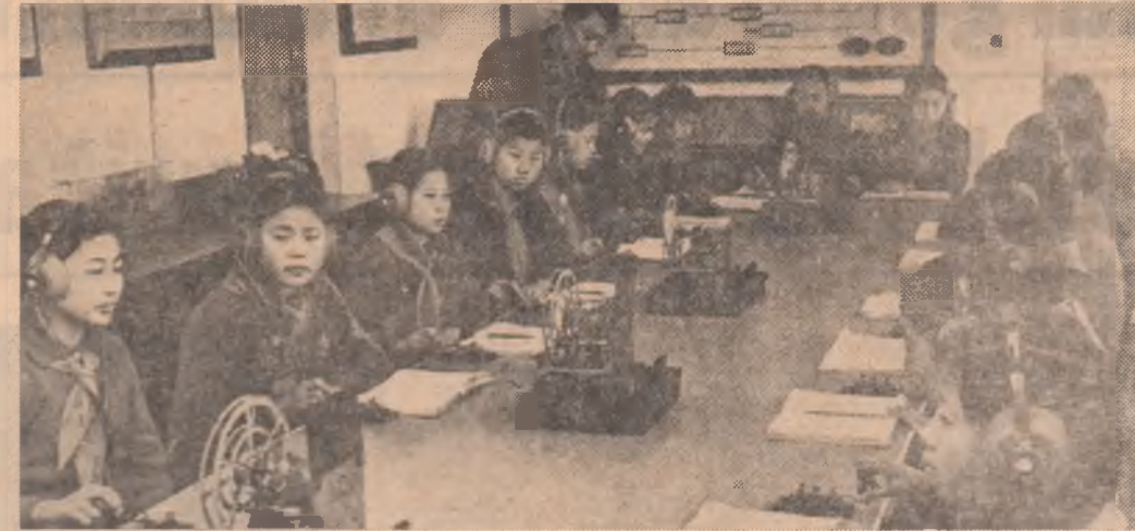
R.F.D. COREEANA: Oră de laborator la școala de fete „Chollima Kaesong Somjuk“.

CUBA ȘI VENEZUELA au ratificat acordul bilateral privind sechestrarea de avioane și nave maritime, semnat simultan la Havana și Caracas, în iulie 1973.