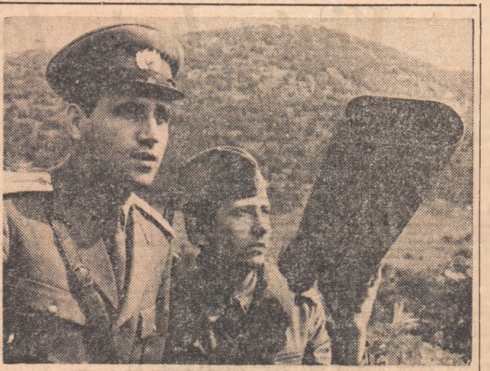
SANTINELE LA HOTARE

IOAN MIHALACHE (Continuare în pag. a II-a)