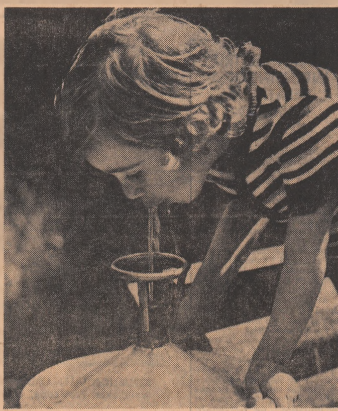
...Căldură mare!