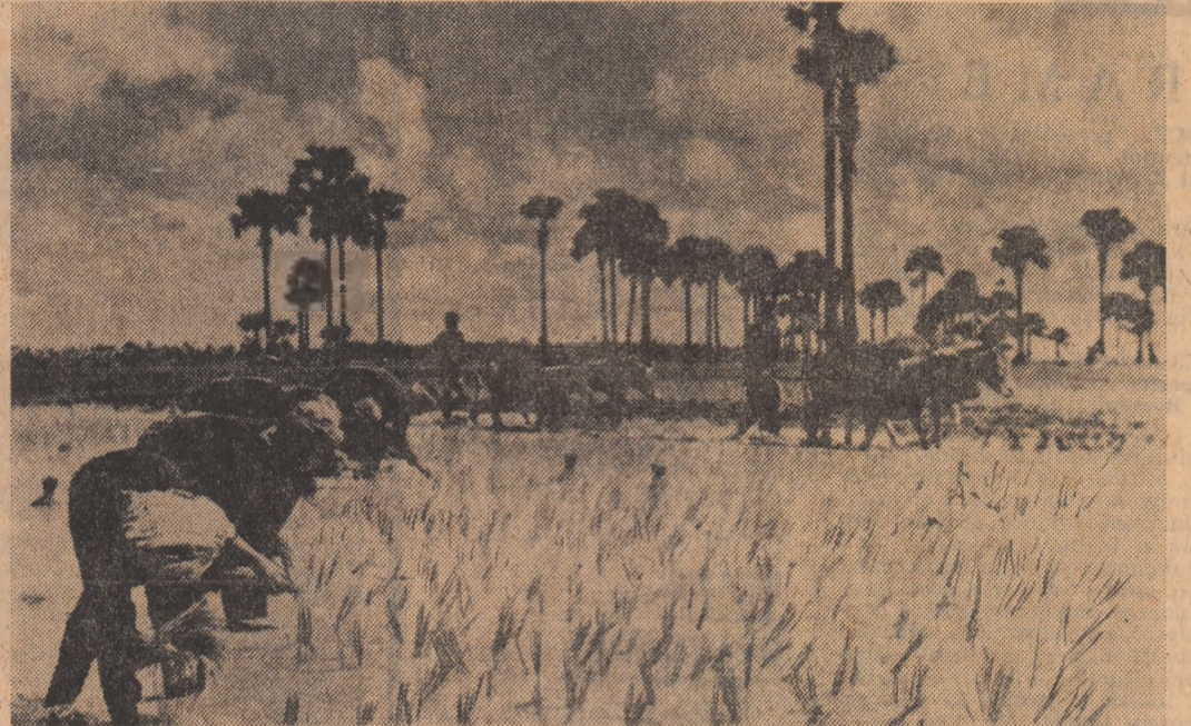
REPUBLICA VIETNAMULUI DE SUD. — Într-o regiune aflată sub controlul Guvernului Revoluționar Provisoriu, o echipă de producție participă la sădirea unei plantații cu orez.