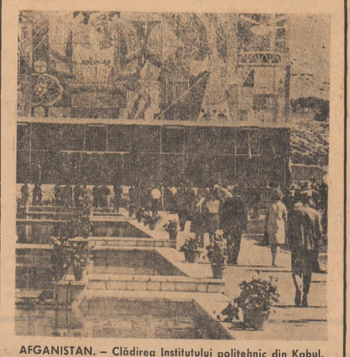
AFGANISTAN. — Clădirea Institutului politehnic din Kabul.

Delegația Guvernului Republicii Vietnamului de Sud la consultările politice, desfășurate între cele două părți sud-vietnameze în suburbia pariziană La-Celle-Saint-Cloud, a dat publicității, la 15 iulie, o declarație în care denunță inscenarea alegerilor în organele locale ale puterii pe care a organizat-o, la 14 iulie, administrația saigonieză.