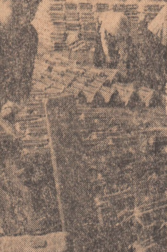
R.D. VIETNAM. În cadrul eforturilor pentru reconstrucția țării, la Fabrica de țigle Quynh Cu din Haiphong se lucrează intens.

La Nicosia și în alte orașe ale țării se menține starea de urgență care nu este ridicată decât în cazuri excepționale. Lezăturile telefonice și teleax cu Cipru rămîn întrerupte încă de la declanșarea loviturii de stat. Aeroportul din Nicosia a fost reînchis, sub un strict control al juntei militare, în vederea transportării numărului mare de tineri străini, care se grăbesc să părăsesc Ciprul din cauza recentelor evenimente.