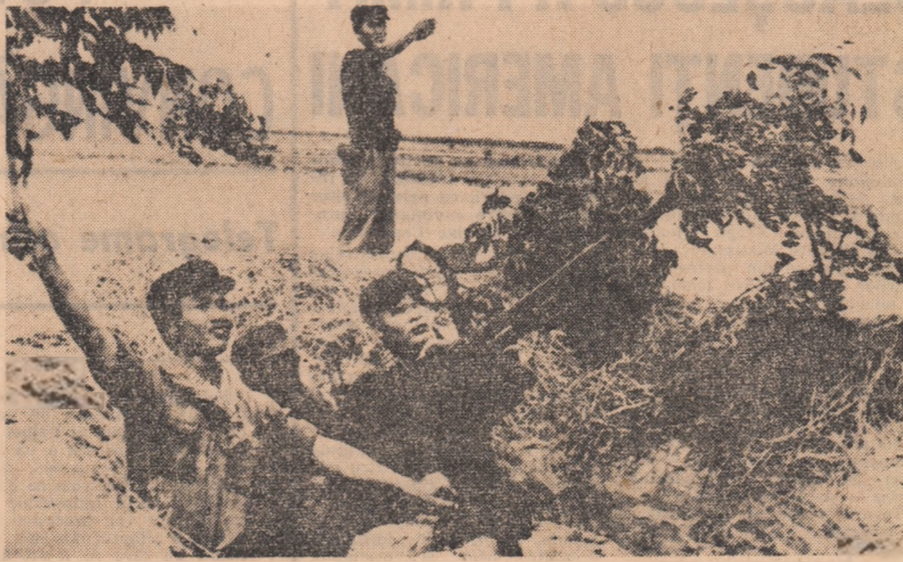
CAMBODGIA: Un grup de patrioți khmeri în cursul unei operațiuni militare.